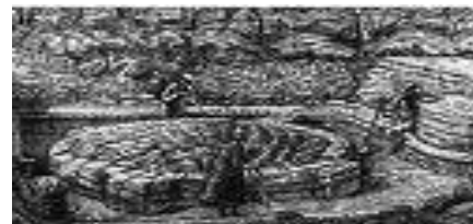
Рис. 11. Жертовник в деревне Погова — автор: В. В. Тарасов

□ - в души умерших предков и в духов (одухотворённые силы);