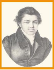
Н.М. Языков (Дерпт. 1822 г.)