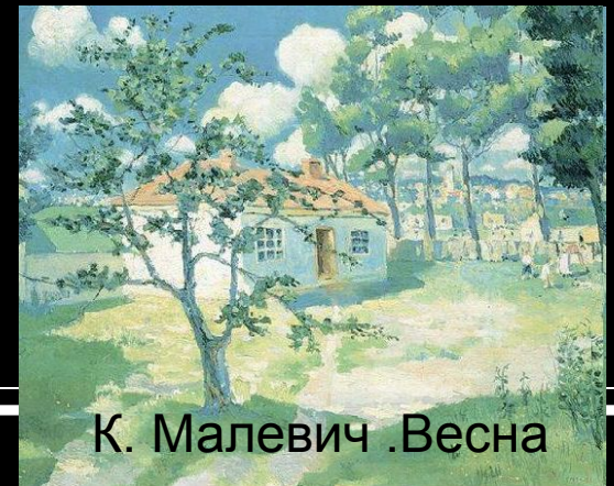
К. Малевич .Весна