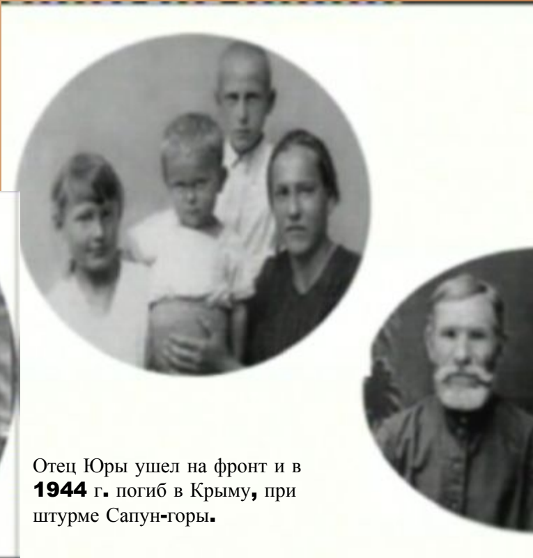
Отец Юры ушел на фронт и в 1944 г. погиб в Крыму, при штурме Сапун-горы.