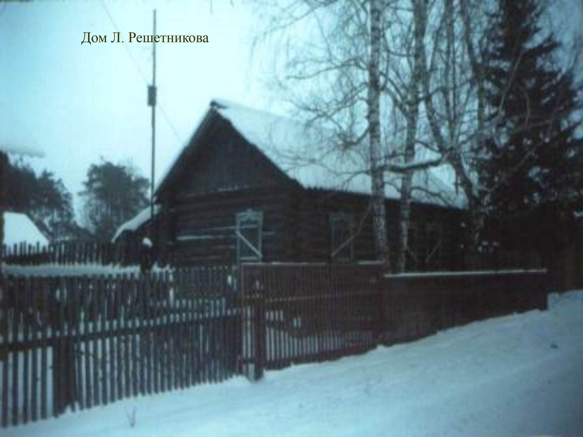
Дом Л. Решетникова