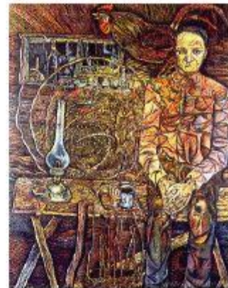
А. Платонов. Художник Н. Ромадин