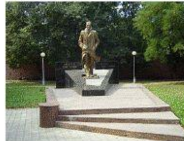
Памятник в Воронеже