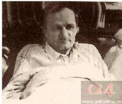
Фото 1951 г.