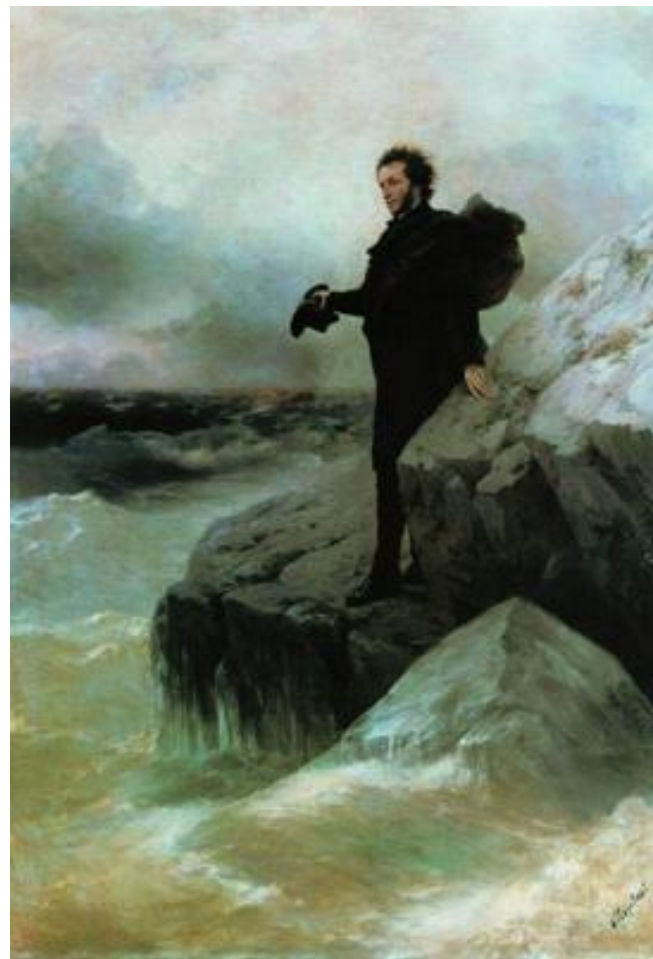
И. Айвазовский Прощание А. С. Пушкина с морем.