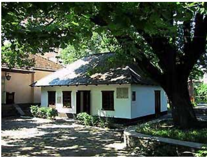
Дом-музей А.С.Пушкина в Кишиневе