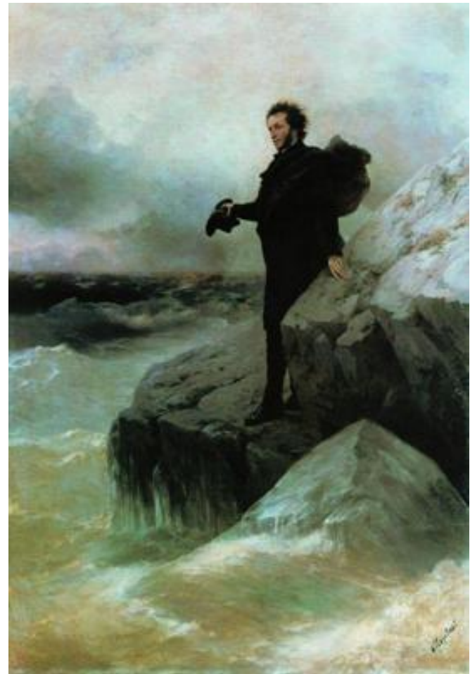
И. Айвазовский Прощание А. С. Пушкина с морем.