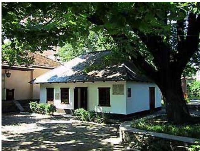
Дом-музей А.С.Пушкина в Кишиневе