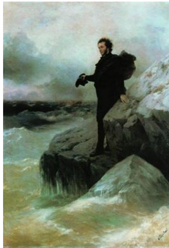
И. Айвазовский Прощание А. С. Пушкина с морем.