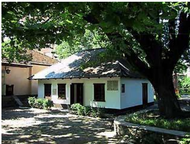
Дом-музей А.С.Пушкина в Кишиневе