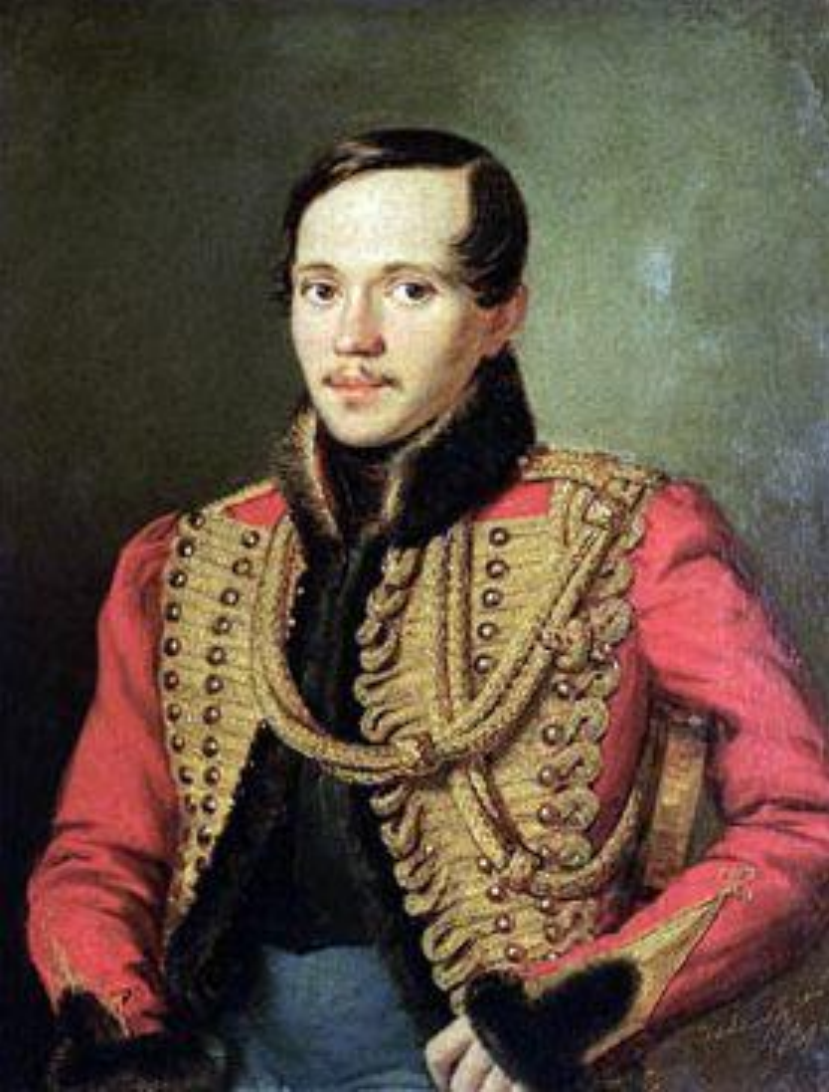
Лермонтов в расстёгнутом ментике с золотыми шнурками. 1837. П.Е. Заболотский.

К портрету Лермонтова Казался ты и сумрачным и властным, Безумной вспышкой непреклонных сил; Но ты мечтал об ангельски прекрасном, Ты демонски-мятежное любил!