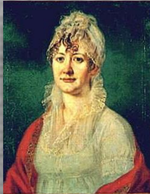
Арсеньева Елизавета Алексеевна (1773-1845)