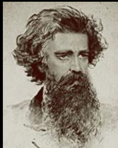
Владимир Соловьёв [16 января 1853 - 31 июля 1900]