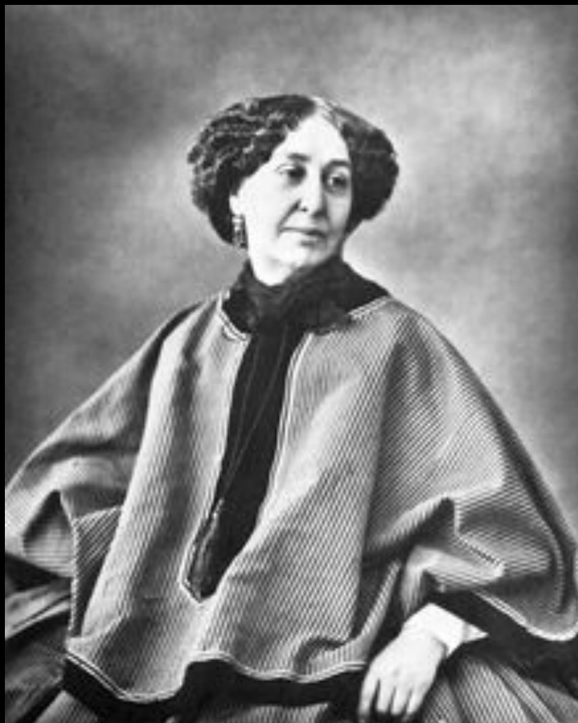
Жорж Санд французская писательница.