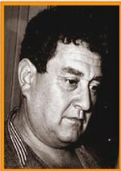
Драгунский Виктор Юзефович 1913 - 1972

Драгунский часто получал письма от юных читателей и всегда старался ответить на них. Каждое своё послание он заканчивал девизом: «ДРУЖБА! ВЕРНОСТЬ! ЧЕСТЬ!»