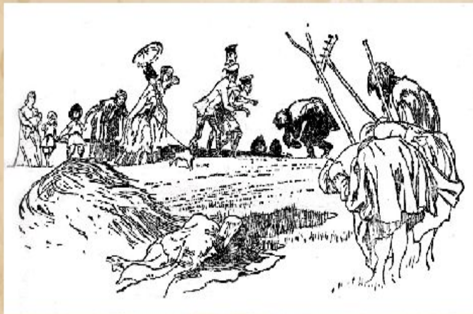
И. Годин. Иллюстрация к поэме Н.А. Некрасова «Кому на Руси жить хорошо».

В поэме «Кому на Руси жить хорошо» Н.А. Некрасов изобразил жизнь народа в один из самых сложных моментов истории.