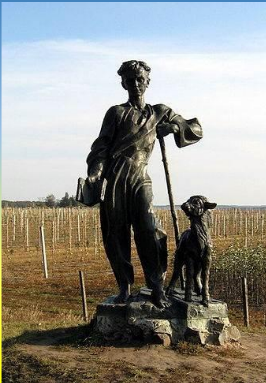
Пам'ятник малому Тарасу Шевченку-пастушку в с. Шевченкове (Звенигородський р-н).