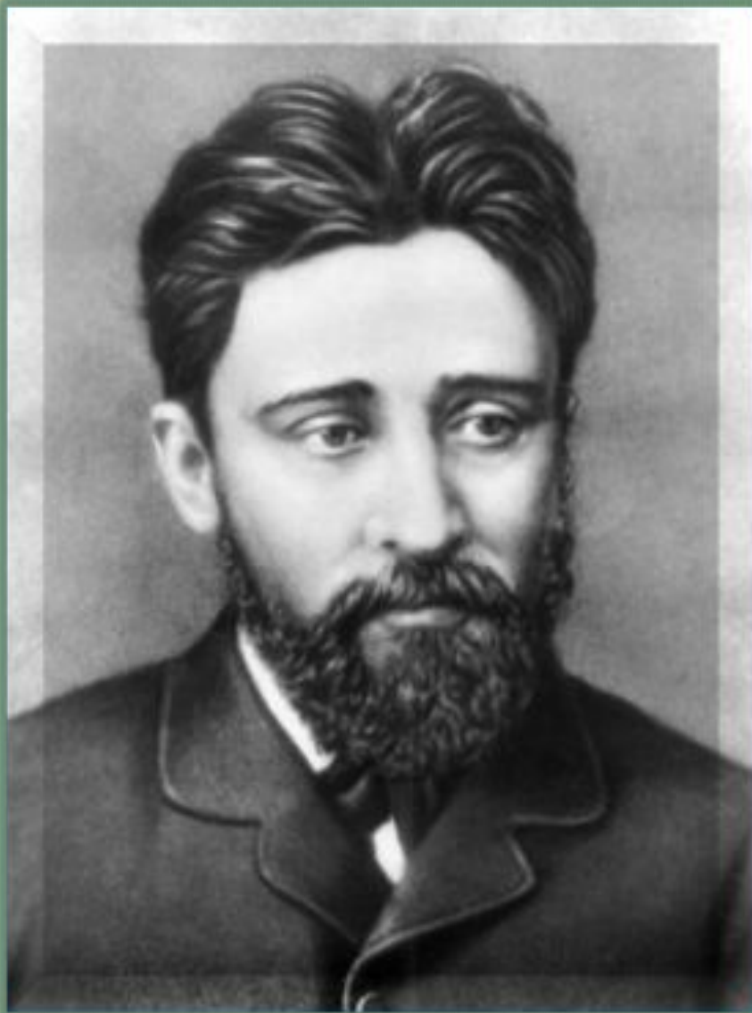
Всеволод Михайлович Гаршин (1855-1888)