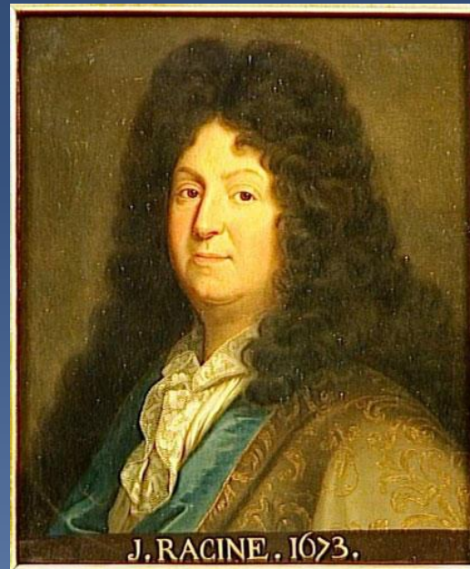
J. RACINE. 1673.