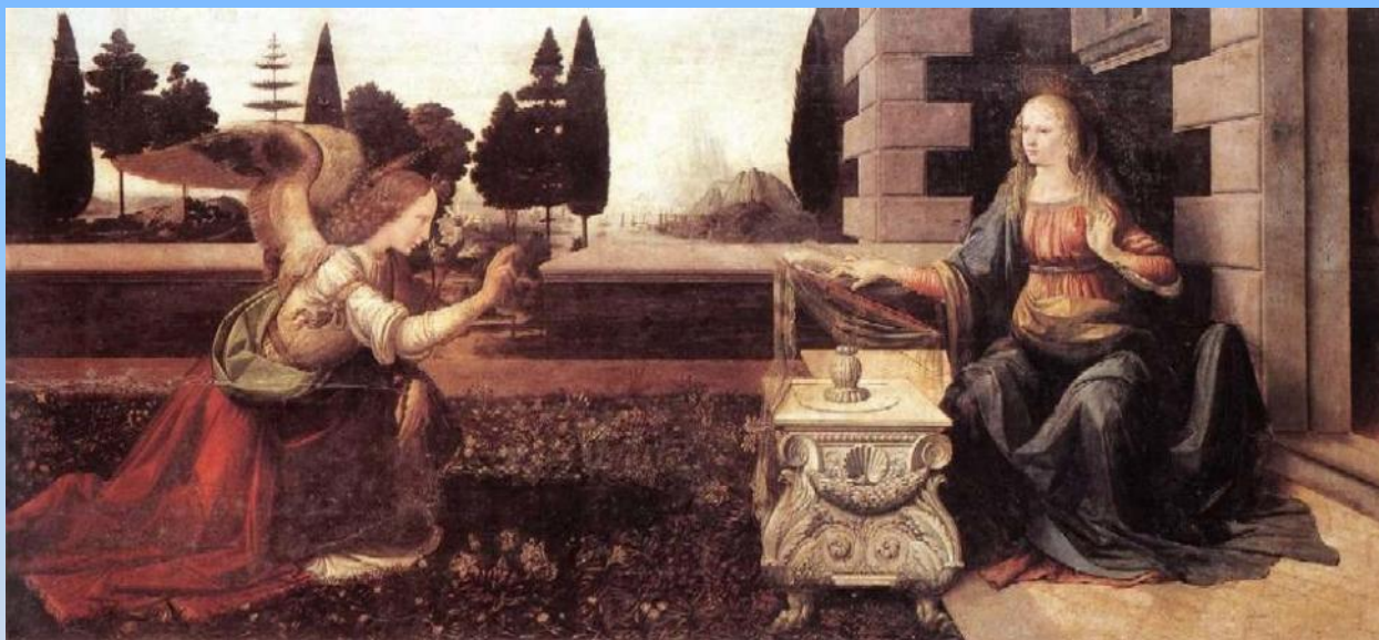
Леонардо да Винчи «Благовещение»

Какая картина, по вашему мнению, наиболее близка к стихотворению “Ангел”?