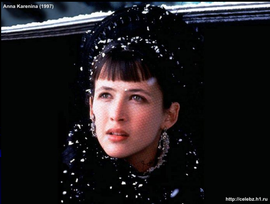
Anna Karenina (1997)