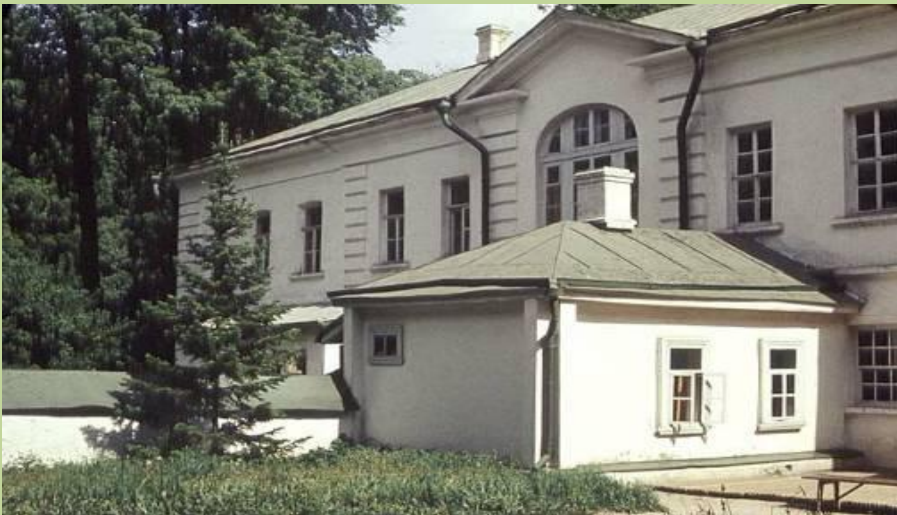
Ясная Поляна. Главное здание усадьбы Л. Н. Толстого.