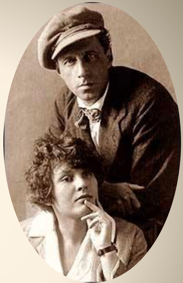
Зинаида Райх и Всеволод Мейерхольд

Осенью 1921 года Зинаида попала в студию к Всеволоду Мейерхольду. Он сделал из неё великолепную актрису, подарил Зинаиде дом, семью, усыновил детей Есенина. Зинаида Николаевна жила словно в очарованном мире, но Есенин вновь возник в её жизни. Успехи бывшей жены удивили, нежность и признательность, которые Зиночка испытывала к Мейерхольду, ранили. Поэт кинулся на новый приступ, и казалось, он одержал верх в этой молчаливой схватке, когда Зинаида Николаевна начала тайком с ним встречаться. Но эти встречи лишь добавляли горечи и боли в их сложные отношения. В одну из таких встреч Райх сказала: "Параллели не скрещиваются"