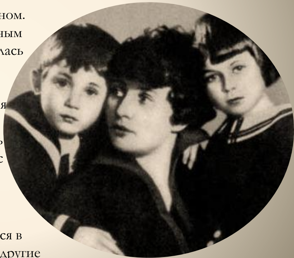
Зинаида Райх с детьми

Она тяжело пережила развод. Есенин находился в зените славы, рядом с ним то и дело мелькали другие женщины. А у Райх двое детей на руках, в доме нищета, душа полностью выжжена.