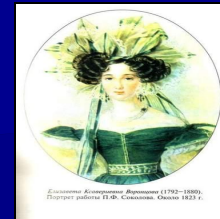
Екатерина Александровна Вяземская (1792–1880). Портрет работы П.Ф. Савицкого. Ок. 1823 г.