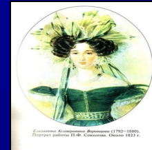
Екатерина Александровна Вяземская (1792–1880). Портрет работы П.Ф. Савицкого. Ок. 1823 г.