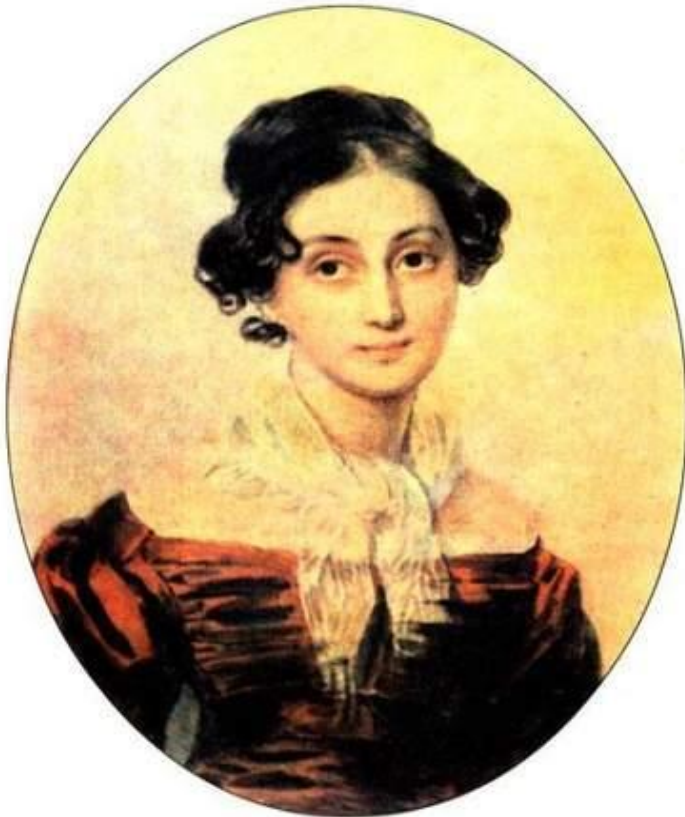
Анна Алексеевна Оленина (1808—1888). Портрет работы П. Ф. Соколова. Около 1825 г.

Что в имени тебе моем? Оно умрет, как шум печальный Волны, плеснувшей в берег дальный, Как звук ночной в лесу глухом.