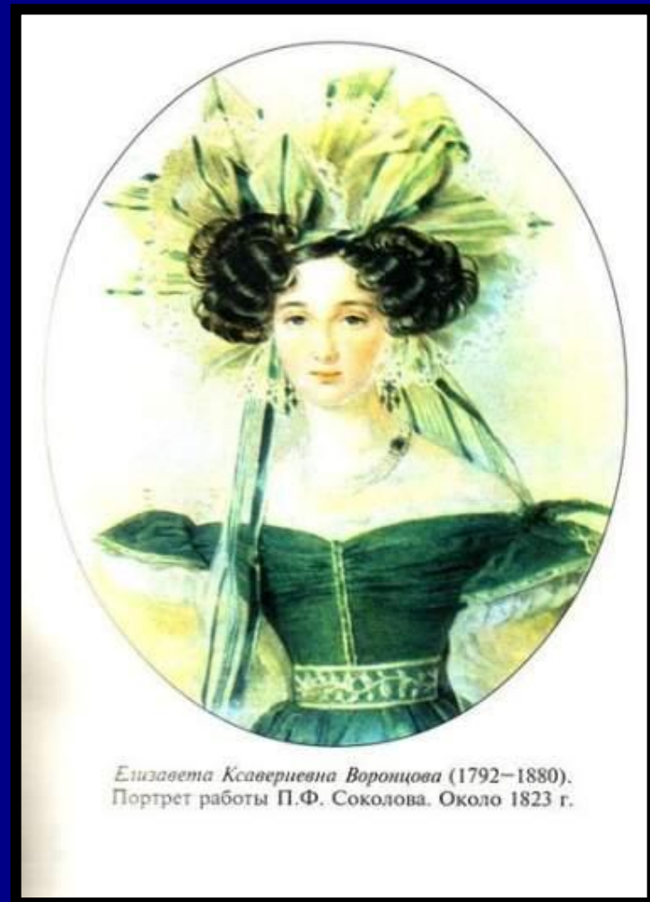
Елизавета Ксаверьевна Воронцова (1792–1880). Портрет работы П.Ф. Соколова. Около 1823 г.

Урожденная графиня Браницкая. Все, знавшие графиню, описывали её как женщину исключительной прелести и очаровывающего благородного изящества.