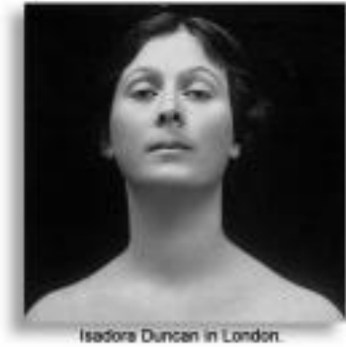
Isadora Duncan in London.