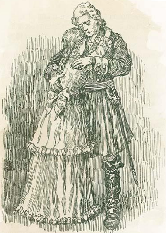
Маша рыдала, прильнувь къ моей груди.