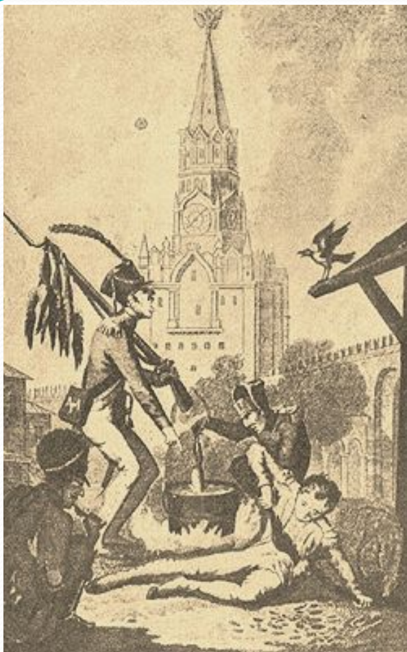
Басня «Ворона и курица»

Воз начал напирать, телега раскатилась: Коня толкает взад, коня кидает вбок; Пустился конь со всех четырех ног