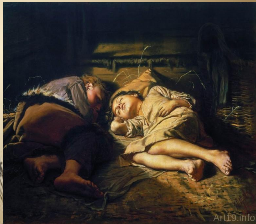
В.Перов «Спящие дети».