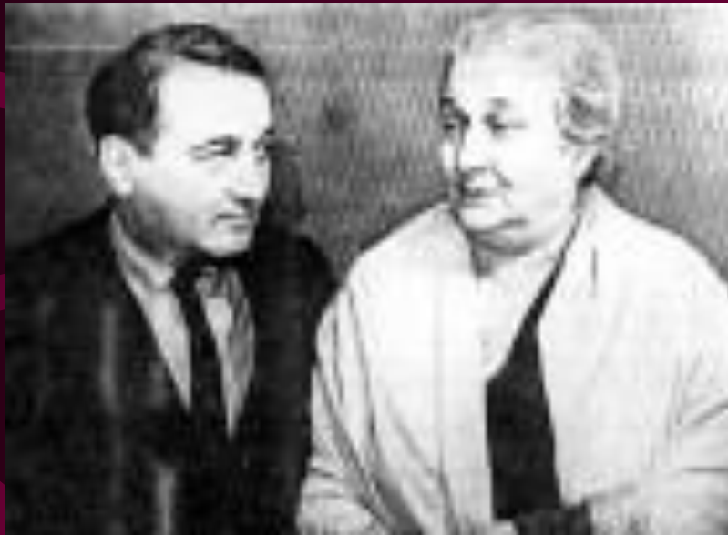
С СЫНОМ ЛЬВОМ