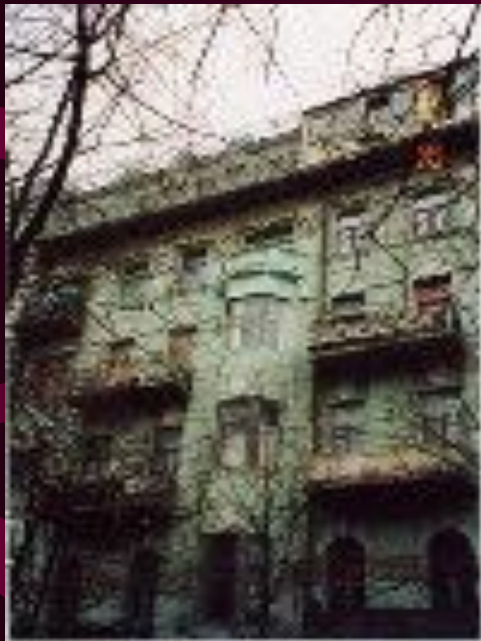
Ахматова в фонтанном доме