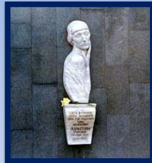
Одесса. Мемориальная доска Ахматовой

Анна Горенко (Ахматова - псевдоним, взятый, по собственным словам, в честь прабабушки, татарской княжны Ахматовой) родилась 11 (23) июня 1889 года под Одессой (Большой Фонтан). Её отец был в то время отставной инженер-механик флота. Годовалым ребенком она была перевезена на север - в Царское Село. Там она прожила до шестнадцати лет.