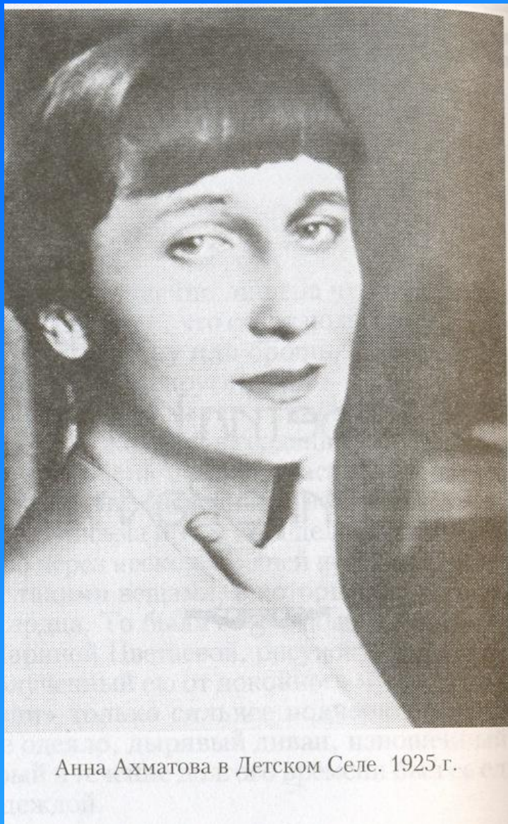
Анна Ахматова в Детском Селе. 1925 г.

Я – голос ваш, жар вашего дыханья, Я – отраженье вашего лица. Напрасных крыл напрасны трепетанья, - Ведь все равно я с вами до конца