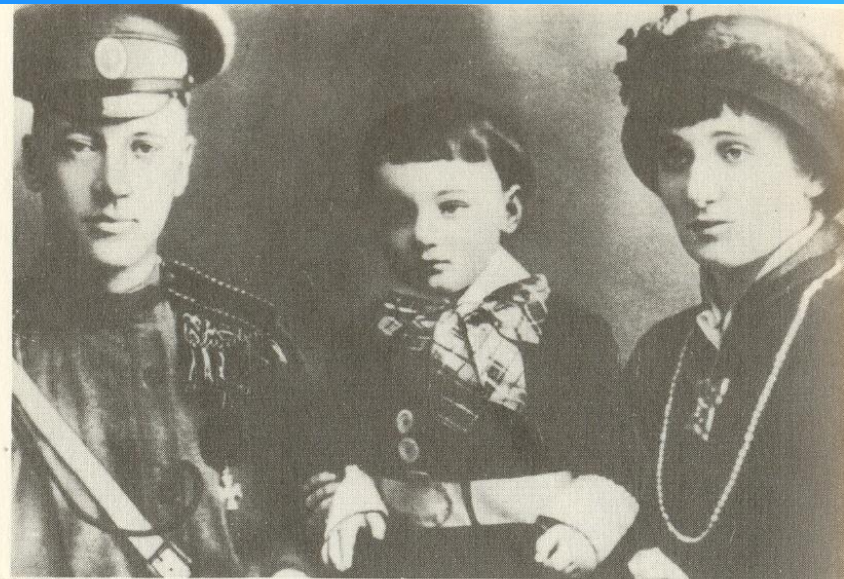
Н. С. Гумилев, Лева Гумилев (сын Гумилева и Ахматовой), А. А. Ахматова. Царское Село. 1916 г.

Дай мне горькие годы недуга, Задыханья, бессонницу, жар, Отыми и ребенка, и друга, И таинственный песенный дар- Так молюсь за твоей литургией После стольких томительных дней, Чтобы туча над темной Россией Стала облаком в славе лучей. Петербург. 1915г.