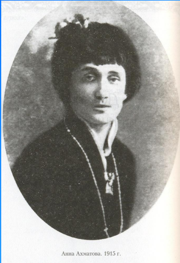
Анна Ахматова. 1915 г.