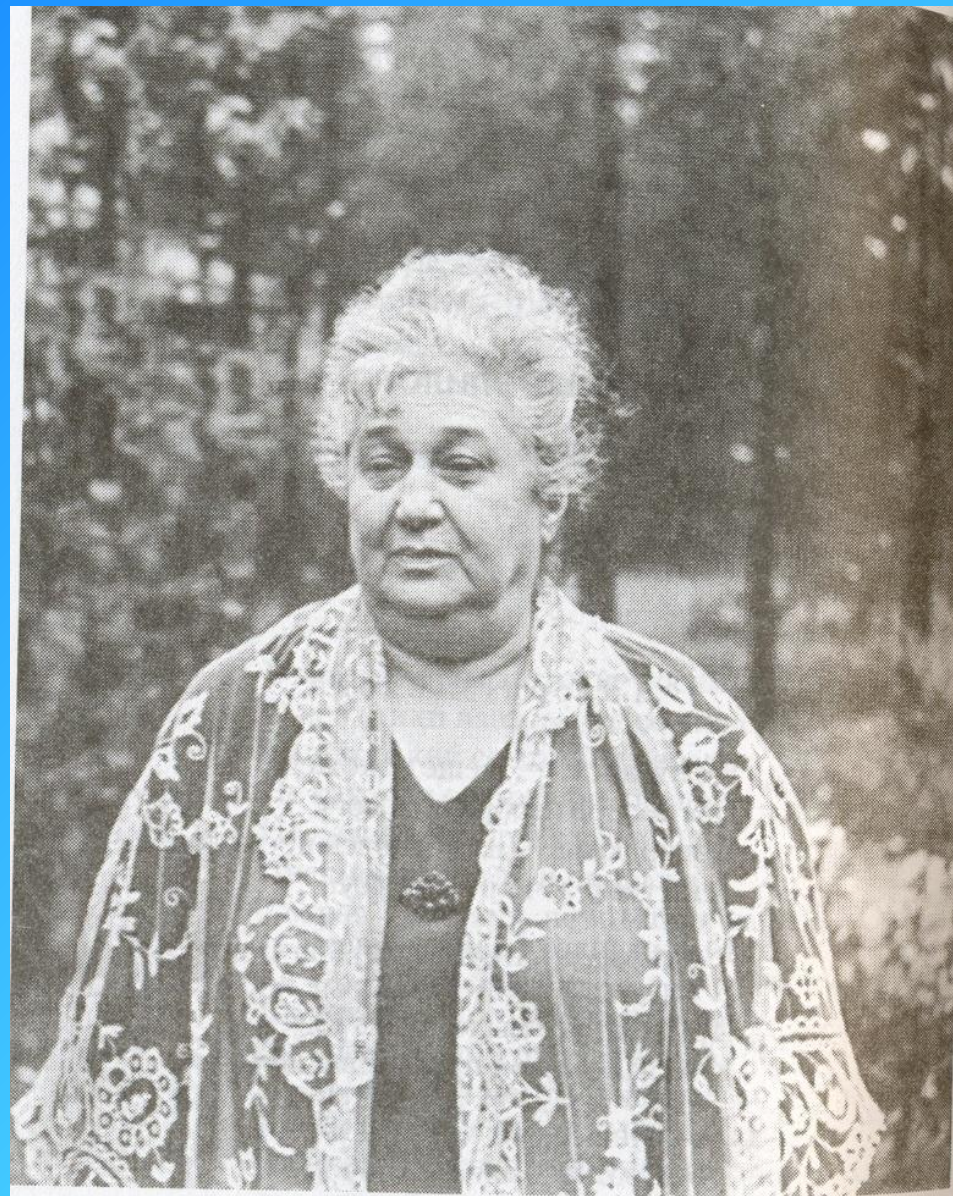
Анна Ахматова. Комарово. Октябрь 1964 г.