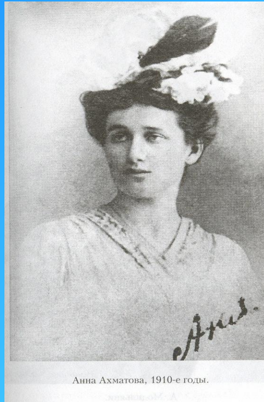
Анна Ахматова, 1910-е годы.