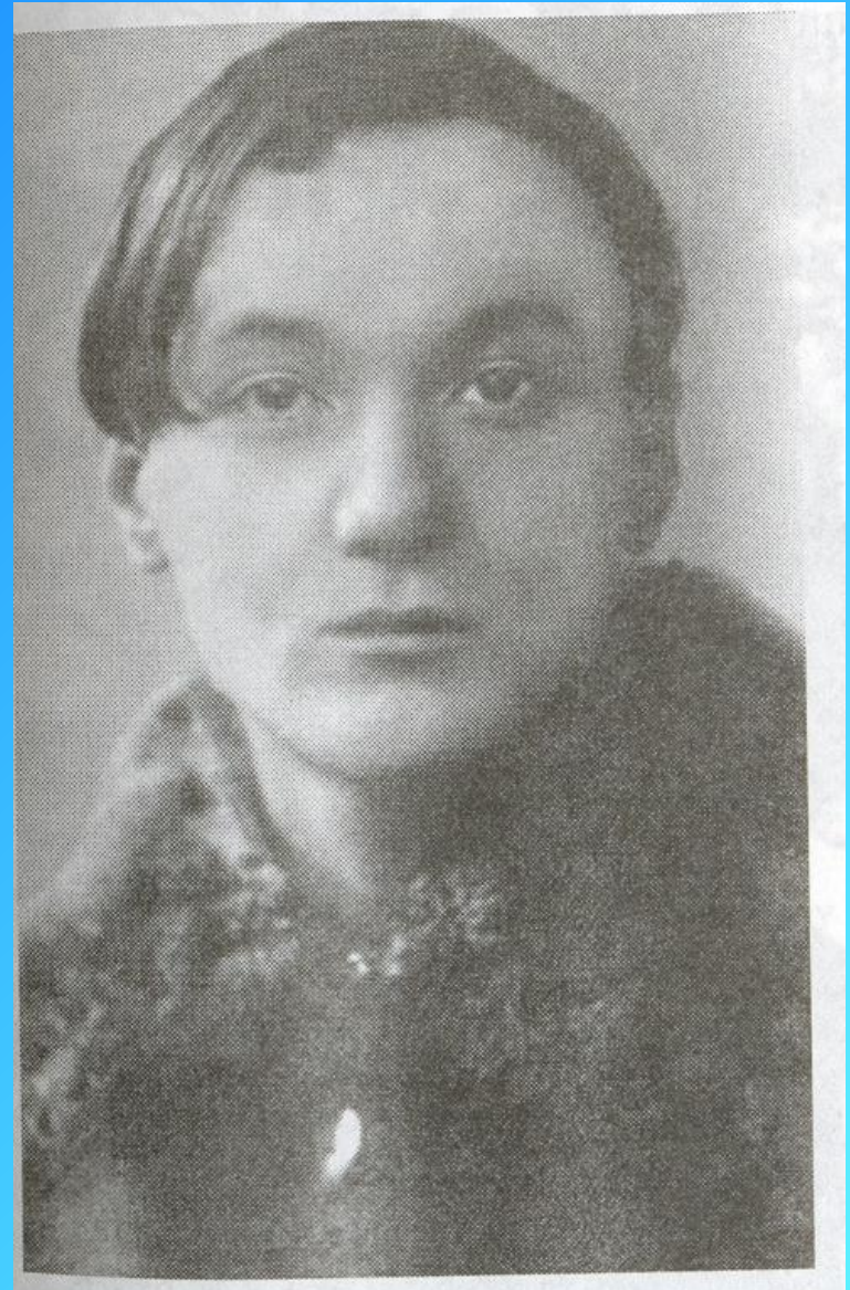
Лев Николаевич Гумилев.

Уводили тебя на рассвете. За тобой, как на выносе, шла, В темной горнице плакали дети, У божницы свеча оплыла. На губах твоих холод иконки, Смертный пот на челе... Не забыть! Буду я, как стрелецкие женки, Под кремлевскими башнями выть.