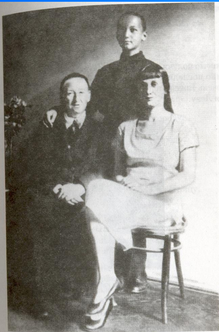
А. И. Гумилева, Лева Гумилев, Анна Ахматова. 1927 г.