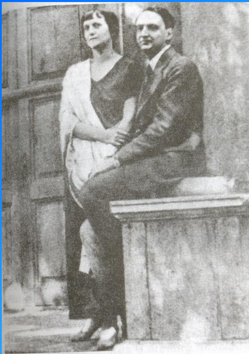
А. А. Ахматова и Н. Н. Пунин. 20-е годы.