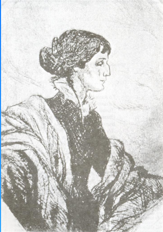
Анна Ахматова, 1914 Рис. О. Делла-Вос-Кардовской