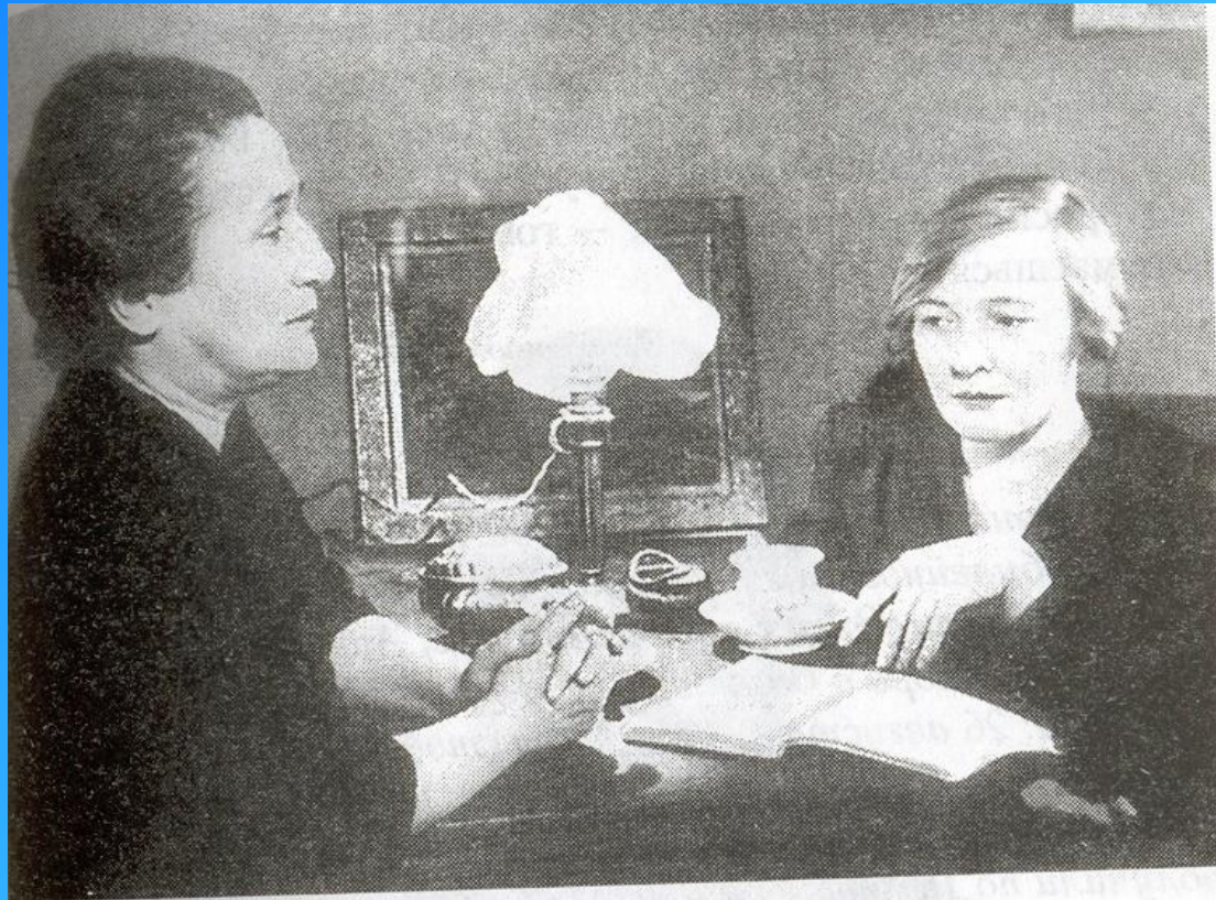
Анна Ахматова и Ольга Берггольц. Ленинград, 1947 г.

Час мужества пробил на наших часах, И мужество нас не покинет.