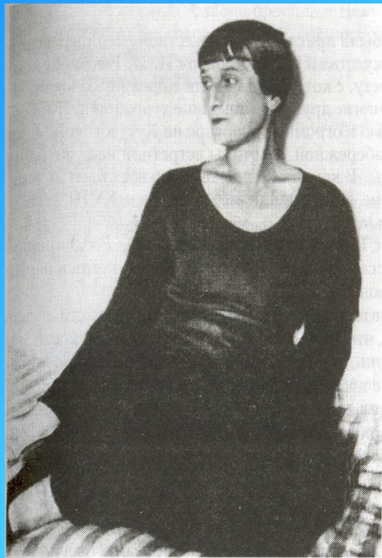
Анна Ахматова. Лето 1936 г.