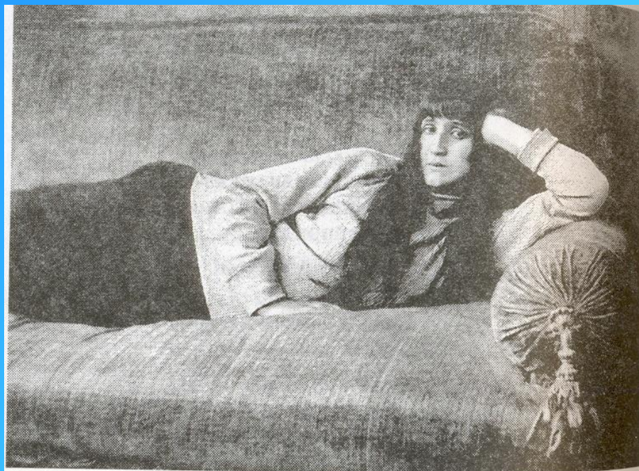
А. Ахматова на даче Шеголевых в Сиверской. 1925 г.