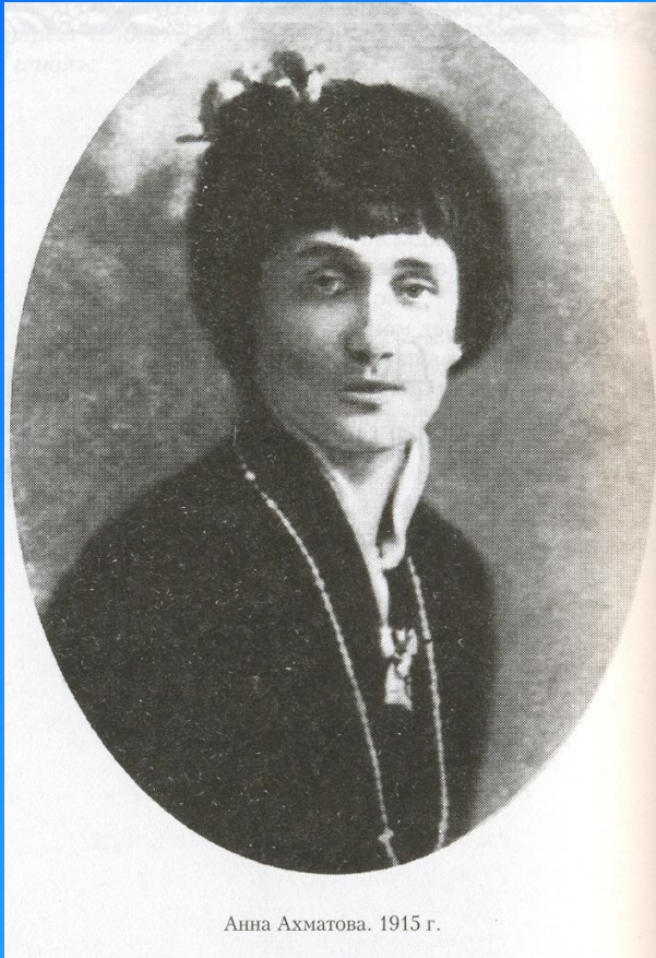
Анна Ахматова. 1915 г.