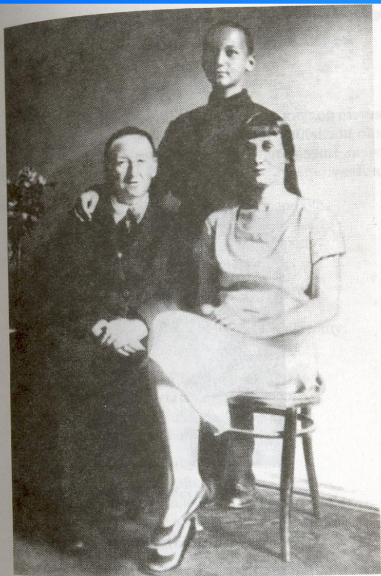
А. И. Гумилева, Лева Гумилев, Анна Ахматова. 1927 г.