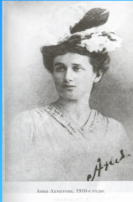
Анна Ахматова, 1910-е годы.