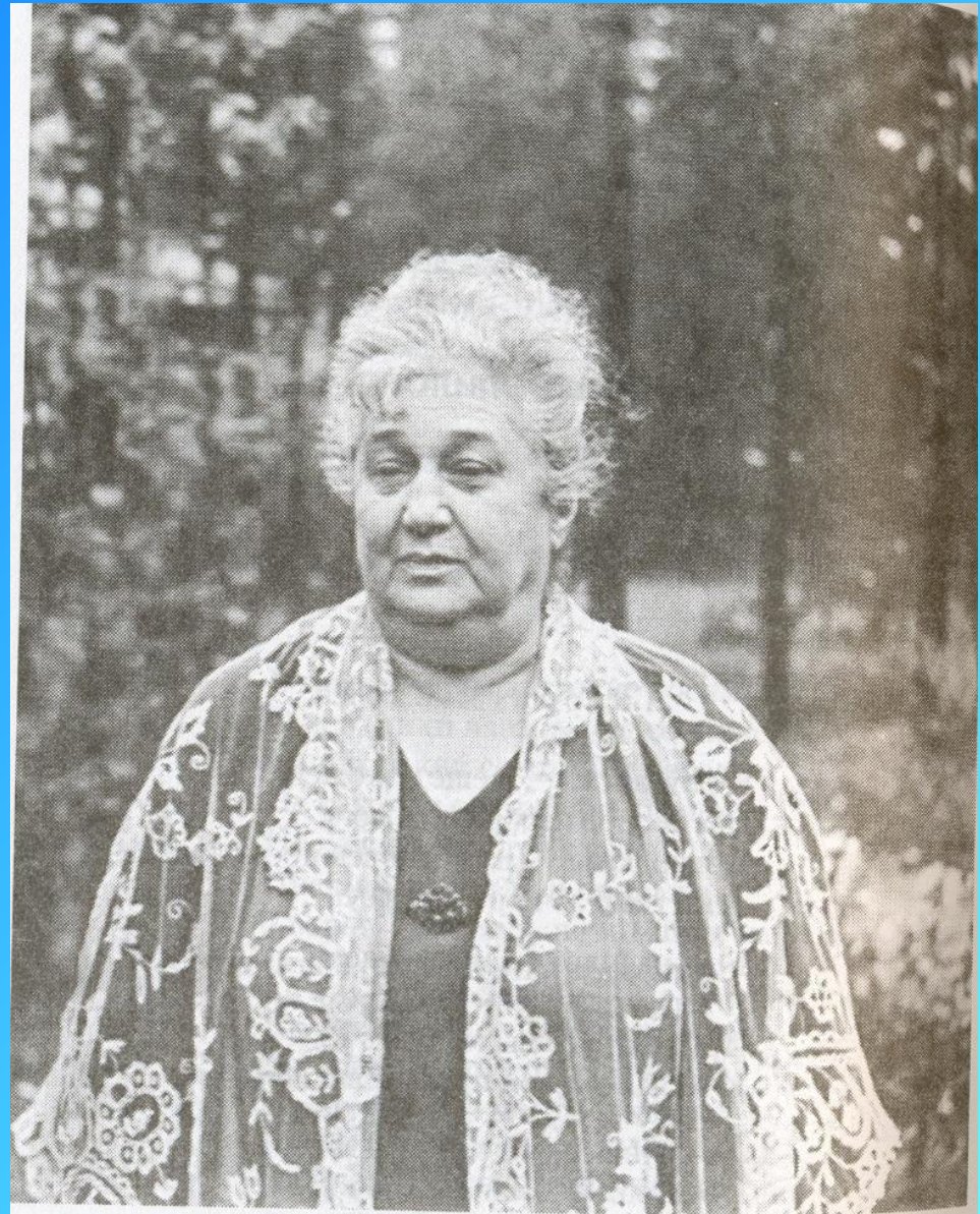
Анна Ахматова. Комарово. Октябрь 1964 г.