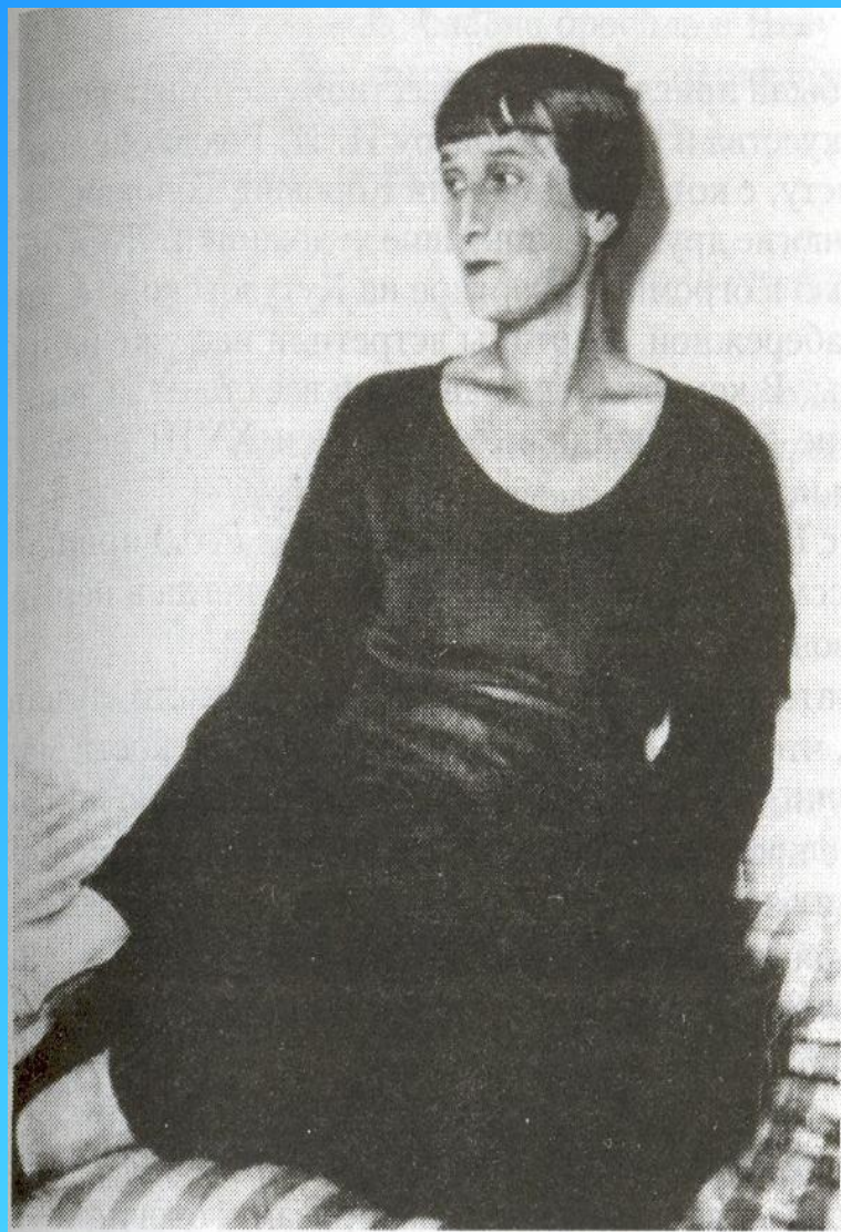
Анна Ахматова. Лето 1936 г.