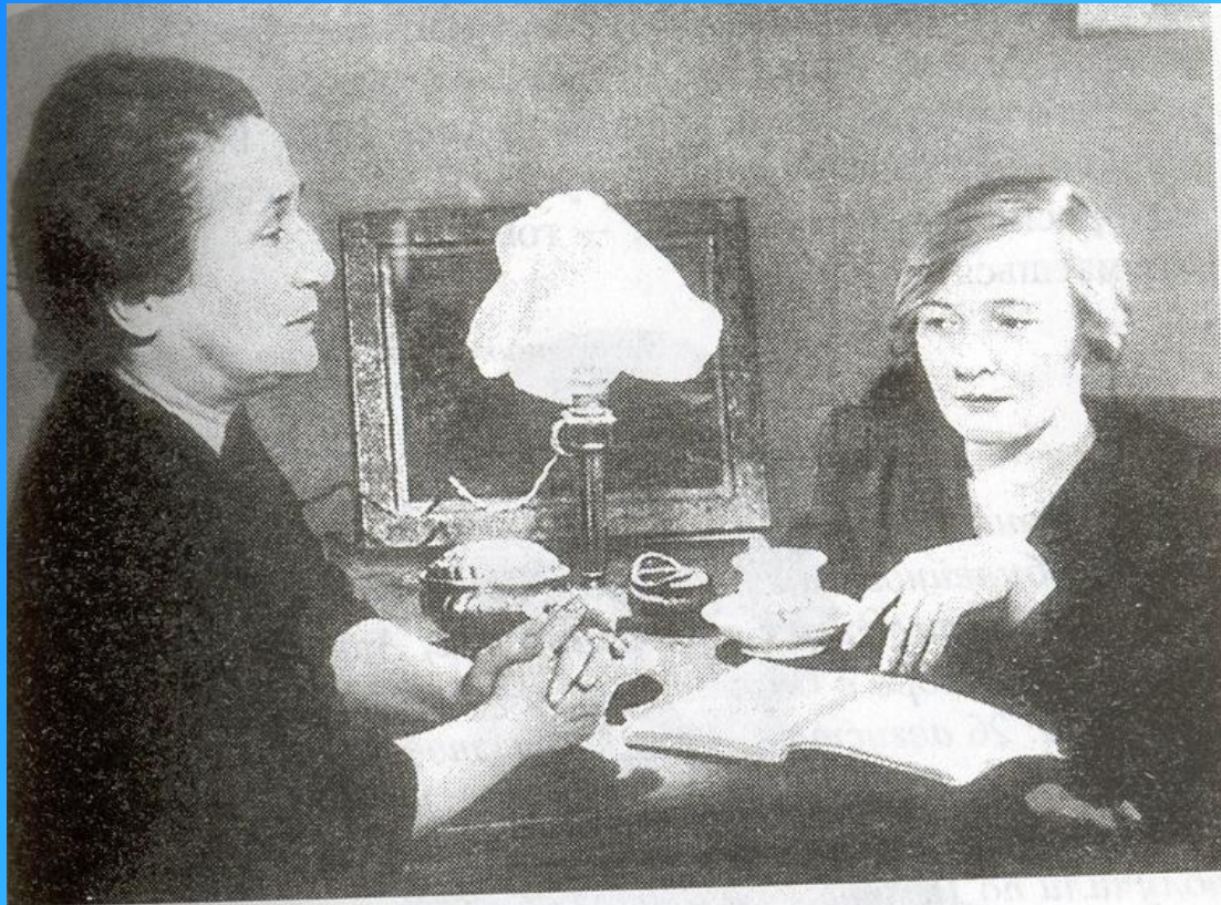
Анна Ахматова и Ольга Берггольц. Ленинград, 1947 г.

Час мужества пробил на наших часах, И мужество нас не покинет.