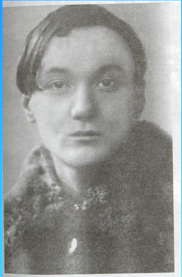
Лев Николаевич Гумилев.

Уводили тебя на рассвете. За тобой, как на выносе, шла, В темной горнице плакали дети, У божницы свеча оплыла. На губах твоих холод иконки, Смертный пот на челе... Не забыть! Буду я, как стрелецкие женки, Под кремлевскими башнями выть.