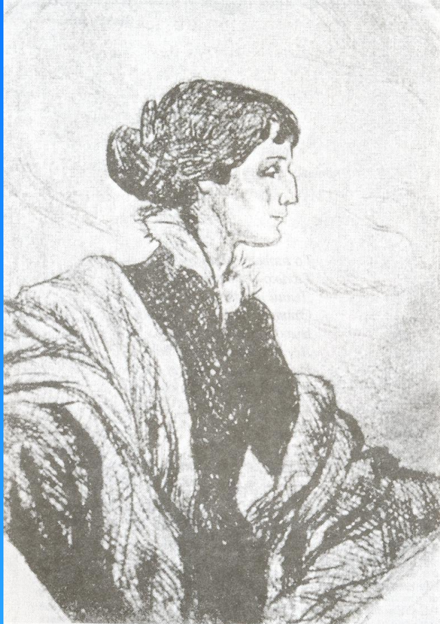
Анна Ахматова, 1914 Рис. О. Делла-Вос-Кардовской