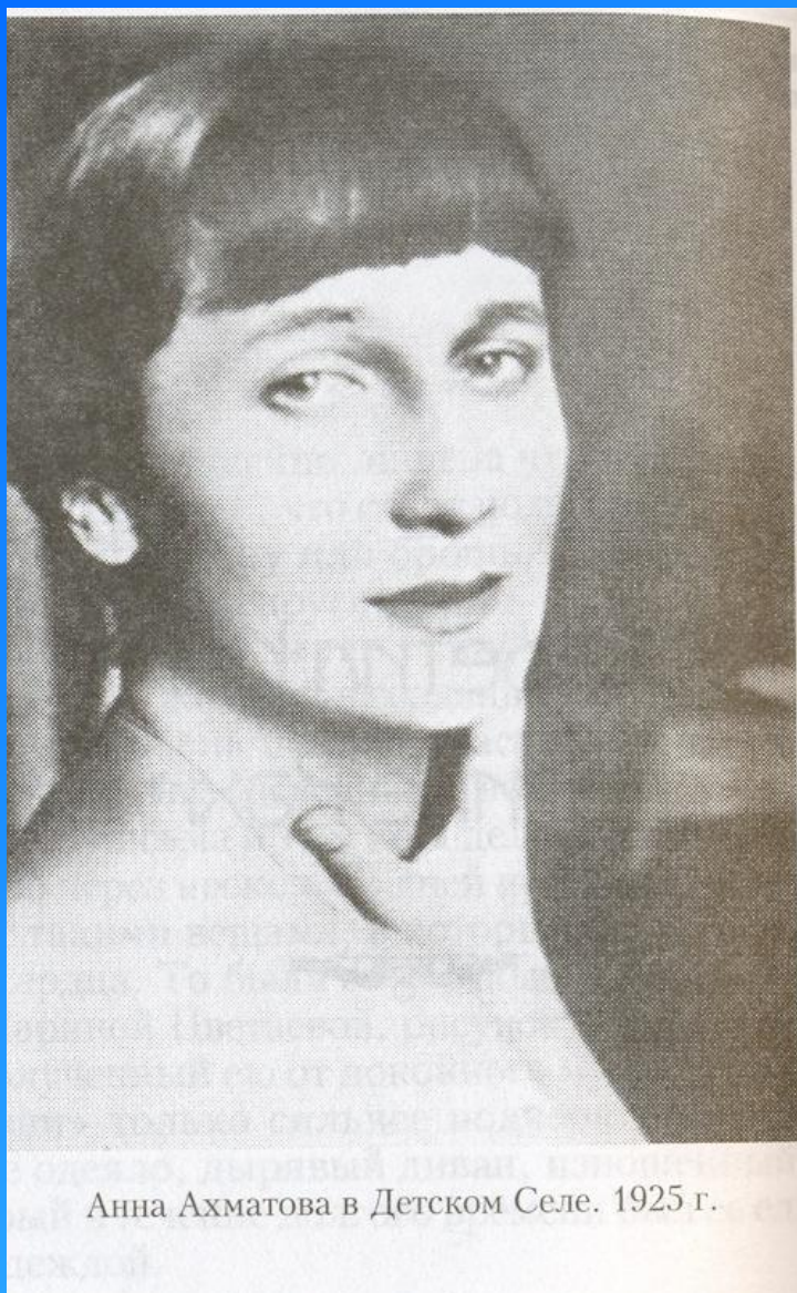
Анна Ахматова в Детском Селе. 1925 г.

Я – голос ваш, жар вашего дыханья, Я – отраженье вашего лица. Напрасных крыл напрасны трепетанья, - Ведь все равно я с вами до конца