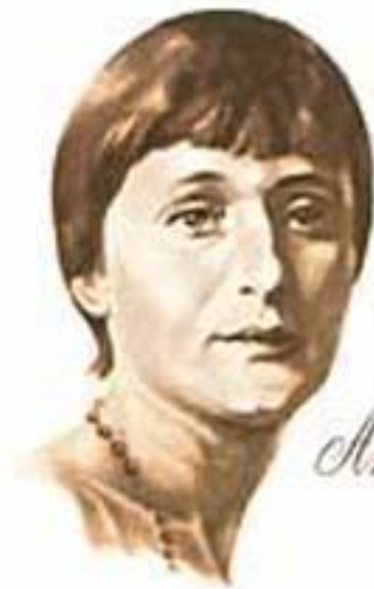
Анна Ахматова 1889 — 1966