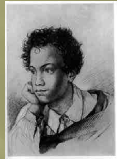
А. С. Пушкин - ученик

Но из всех предметов Саша так и не любил арифметику.