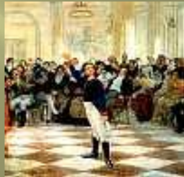
А. С. Пушкин - лицеист