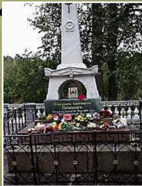
Могила А. С. Пушкина в наше время.