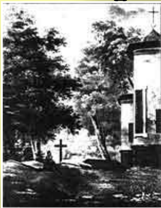
Могила А. С. Пушкина после смерти поэта.