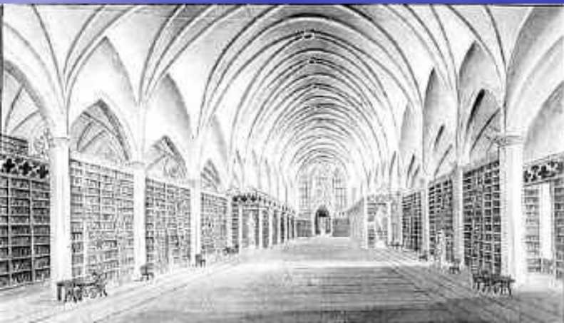
Большой зал библиотеки

В 1813 переезжает в Геттинген и начинает, вместе с братом, преподавательскую деятельность.