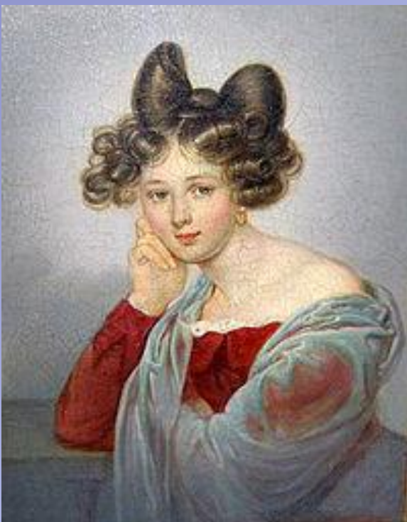
Элеонора Тютчева (Петерсон), первая жена поэта