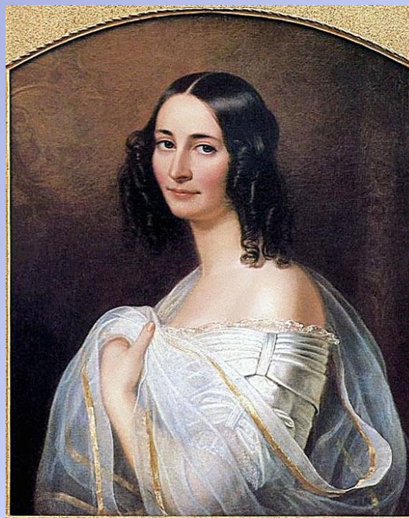
Эрнестина Тютчева (Дернберг), вторая жена поэта