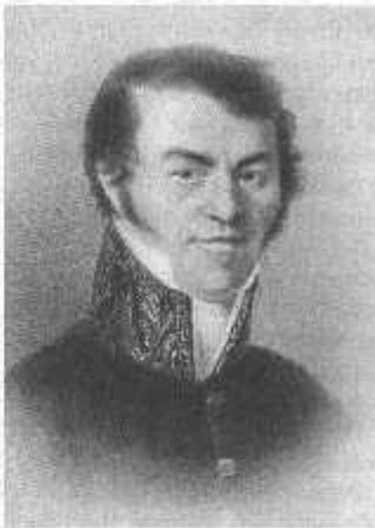
Отец писателя. М. Достоевский.