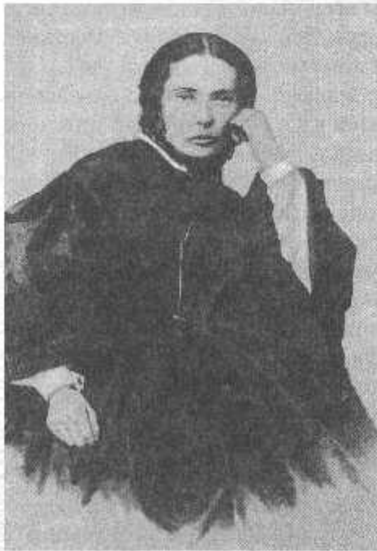
М.Д. Исаева, первая жена Ф.М. Достоевского.