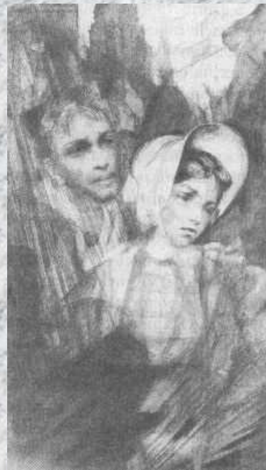
"Белые ночи". Настенька и мечтатель.

1846 - первая повесть, "Бедные люди". В других произведениях 40-х гг. - "Двойник" (1846), "Белые ночи" (1848), "Неточка Незванова" (1849) - возникает тема психологической двойственности человека, характерная и для позднего периода творчества.