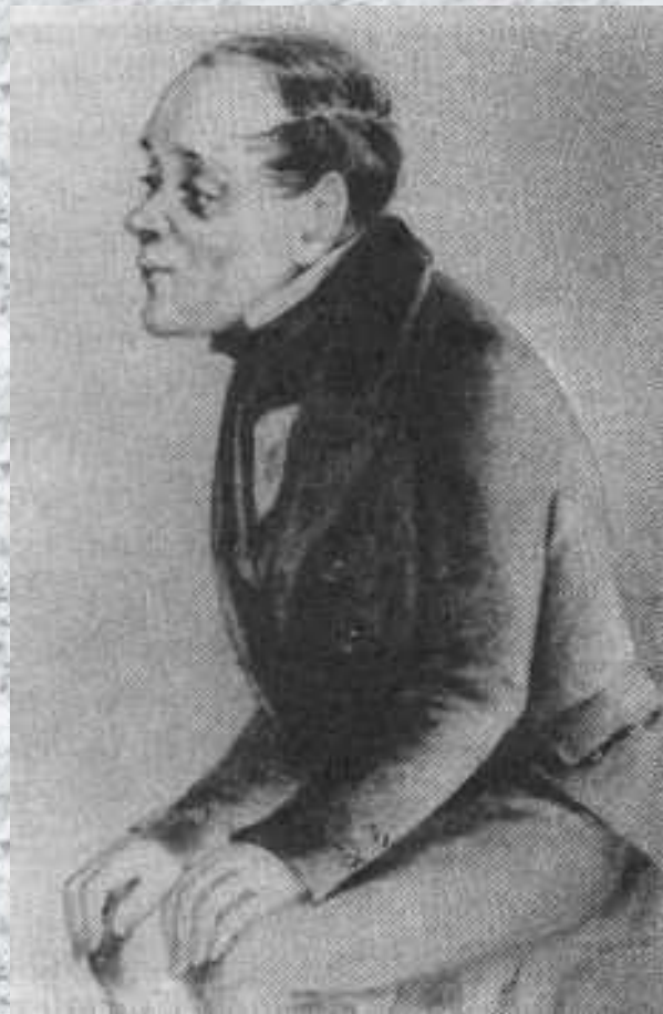
«Бедные люди» Макар Девушкин.

1846 - первая повесть, "Бедные люди". В других произведениях 40-х гг. - "Двойник" (1846), "Белые ночи" (1848), "Неточка Незванова" (1849) - возникает тема психологической двойственности человека, характерная и для позднего периода творчества.