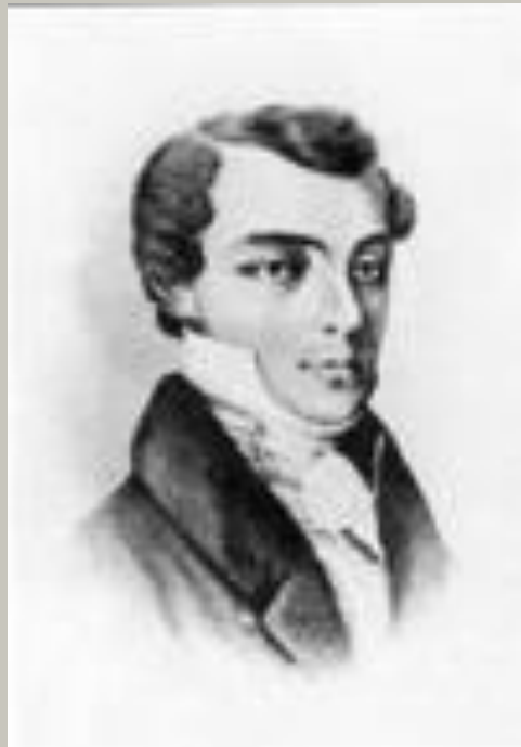
К. Ф. Рылов