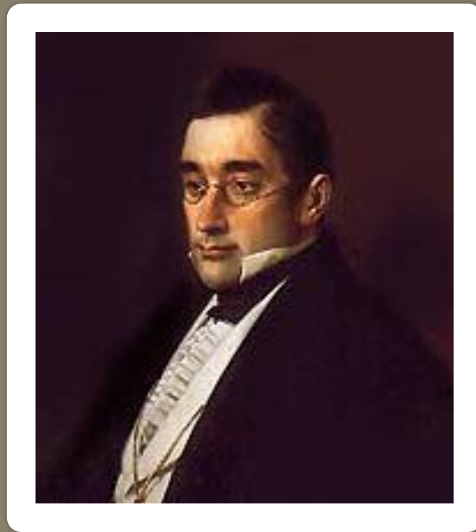
А. С. Грибоедов