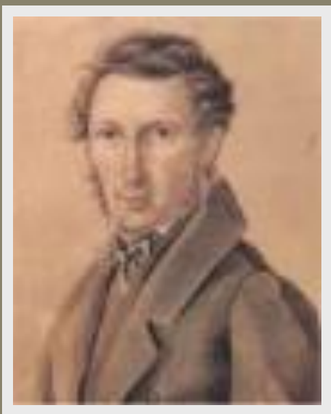
С. П. Трубецкой