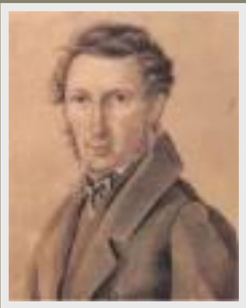
С. П. Трубецкой