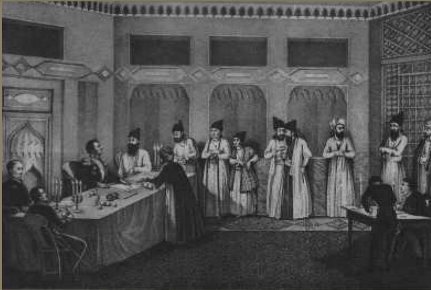
Заключение Туркманчайского мира Художник В. Машков