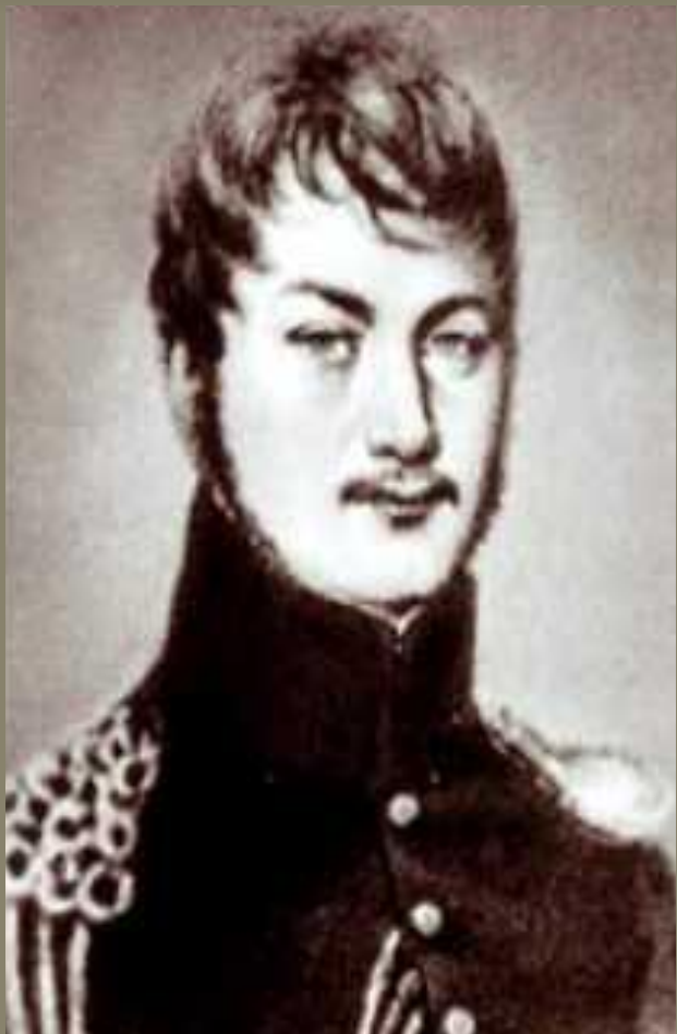
Н. С. Бегичев