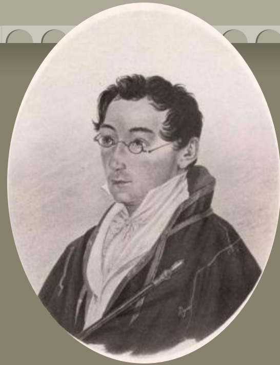
Акварель В. И. Машкова

«Его меланхолический характер, его озлобленный ум, его добродушие, самые слабости и пороки, неизменные спутники человечества, — все в нем было необыкновенно привлекательно»