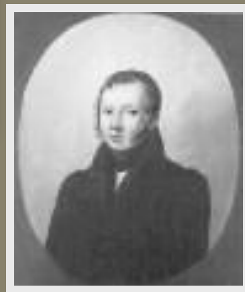
Е. П. Оболенский