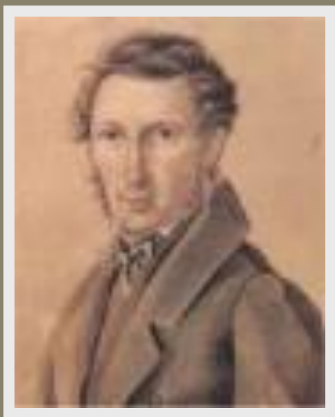
С. П. Трубецкой