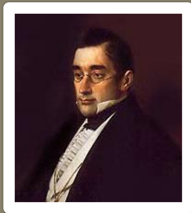
А. С. Грибоедов