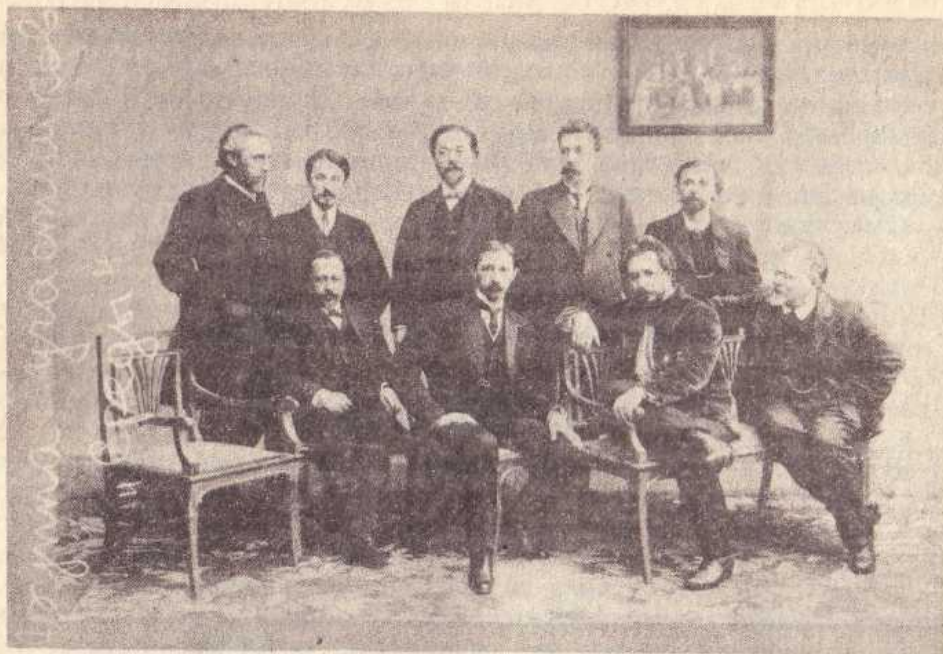
И. А. Бунин среди участников «Сред».