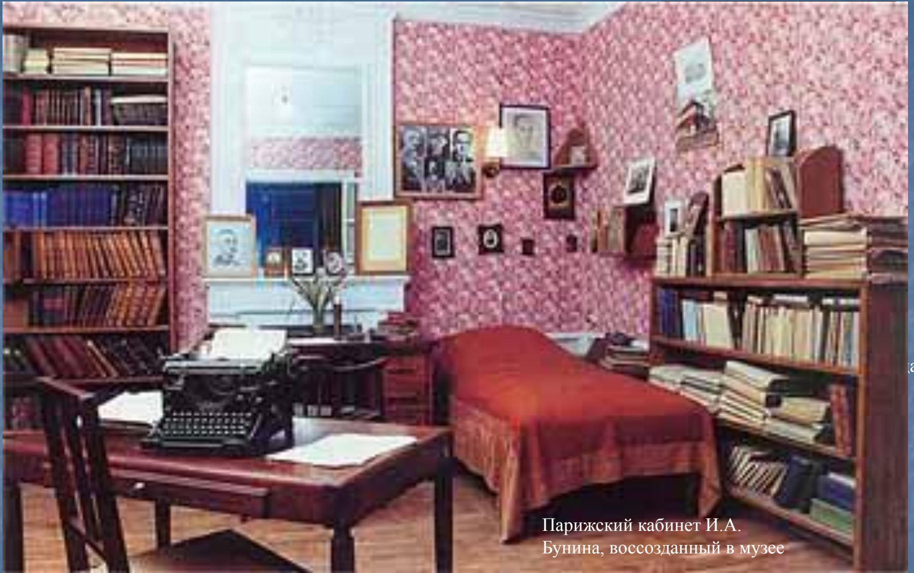
Парижский кабинет И.А. Бунина, воссозданный в музее