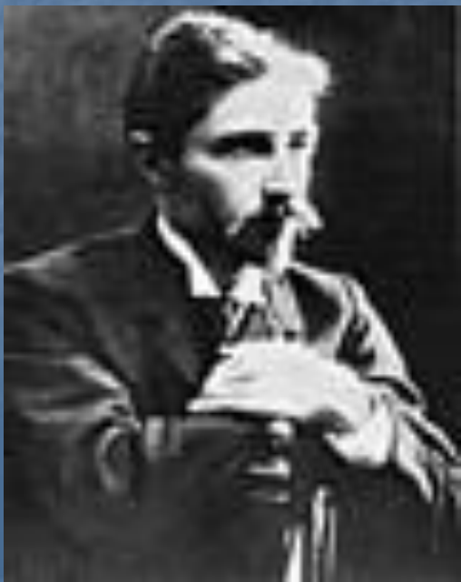
И.А. Бунин, Москва. Начало 1900-х гг.