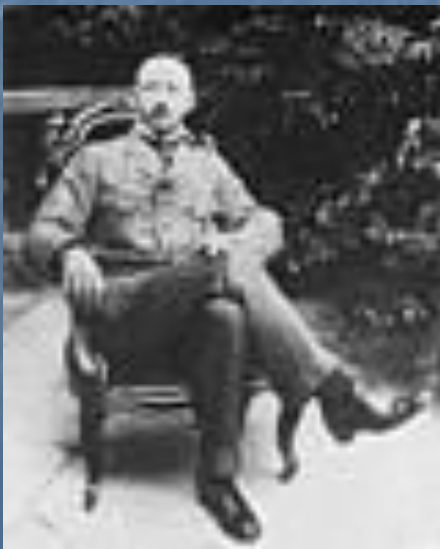
И.А. Бунин. Одесса, 1913 г.

Единственными ценностями, уцелевшими в современном мире, писатель считает любовь, красоту и жизнь природы. Но и любовь бунинских героев трагически окрашена и, как правило, обречена ("Грамматика любви"). Тема соединения любви и смерти, сообщающего предельную остроту и напряженность любовному чувству, свойственна творчеству Бунина до последних лет его писательской жизни.