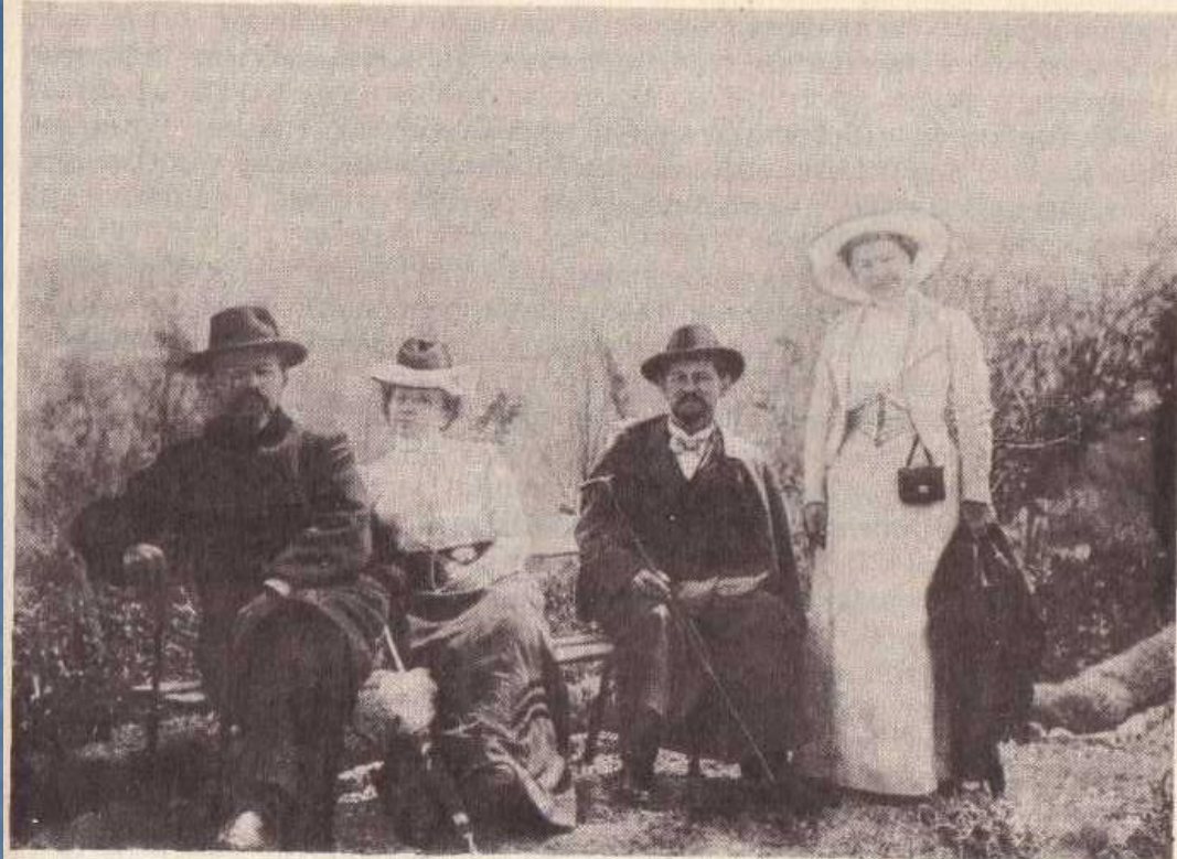
А. П. Чехов, И. А. Бунин, М. П. Чехова (сестра писателя)

Академии наук). Поэзия Бунина уже тогда отличалась преданностью классической традиции, эта черта в дальнейшем пронизывает все его творчество. Принесшая ему известность поэзия сложилась под влиянием Пушкина, Фета, Тютчева. Но она обладала только ей присущими качествами. Так, Бунин тяготеет к чувственно-конкретному образу; картина природы в бунинской поэзии складывается из запахов, остро воспринимаемых красок, звуков. Особую роль играет в бунинской поэзии и прозе эпитет, используемый писателем как бы подчеркнуто субъективно, произвольно, но одновременно наделенный убедительностью чувственного опыта.