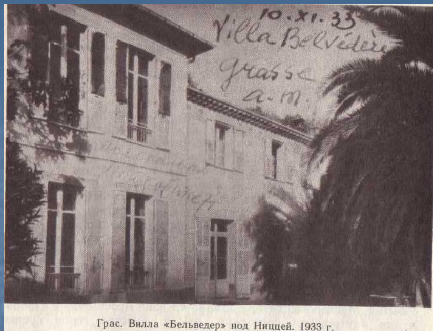
Грас. Вилла «Бельведер» под Ниццей 1933г.

В 1927-1930 Бунин обратился к жанру короткого рассказа ("Слон", "Телячья головка", "Петухи" и др.). Это - результат поисков писателем предельного лаконизма, предельной смысловой насыщенности, смысловой "вместимости" прозы.