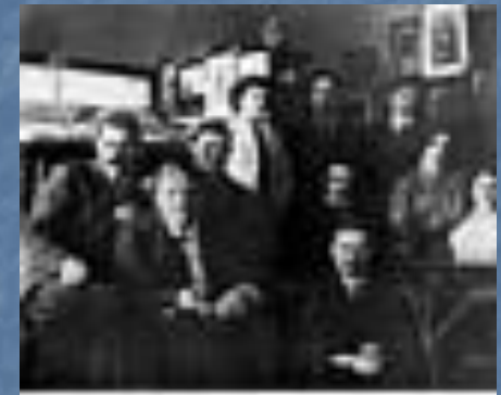
Фотография с надписью Н. Д. Телешова на обороте: "Кабинет Горького. Капри, 1913 г"