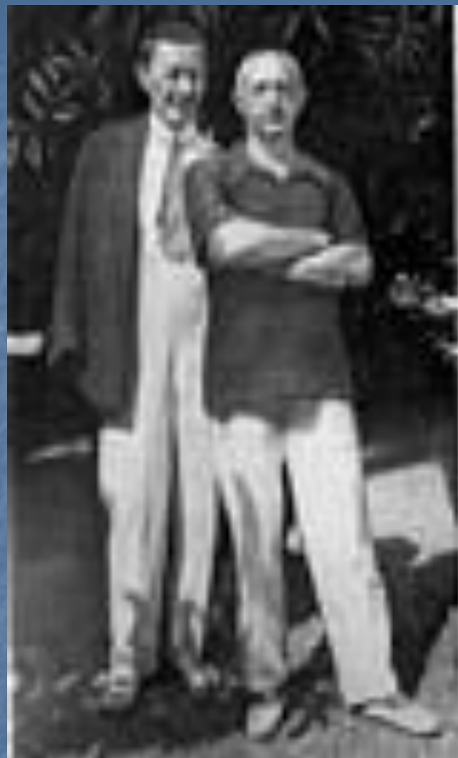
И.А. Бунин, С.В. Рахманинов