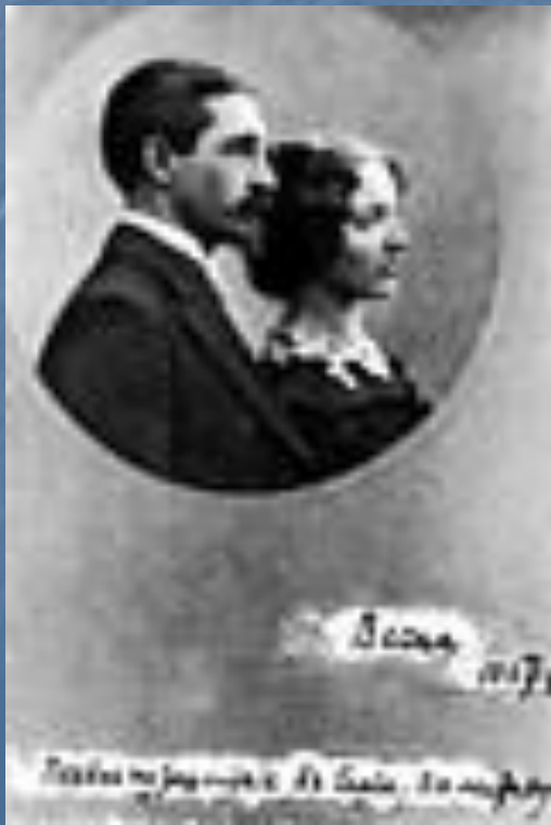
И.А. Бунин, В.Н. Бунина. Надпись Бунина: "Весна 1907 г. Первое путешествие в Сирию, Палестину." 1907 год.

В 1907 Бунины отправились в путешествие по странам Востока - Сирии, Египту, Палестине. Не только яркие, красочные впечатления от путешествия, но и ощущение нового наступившего витка истории дали творчеству Бунина новый, свежий импульс.