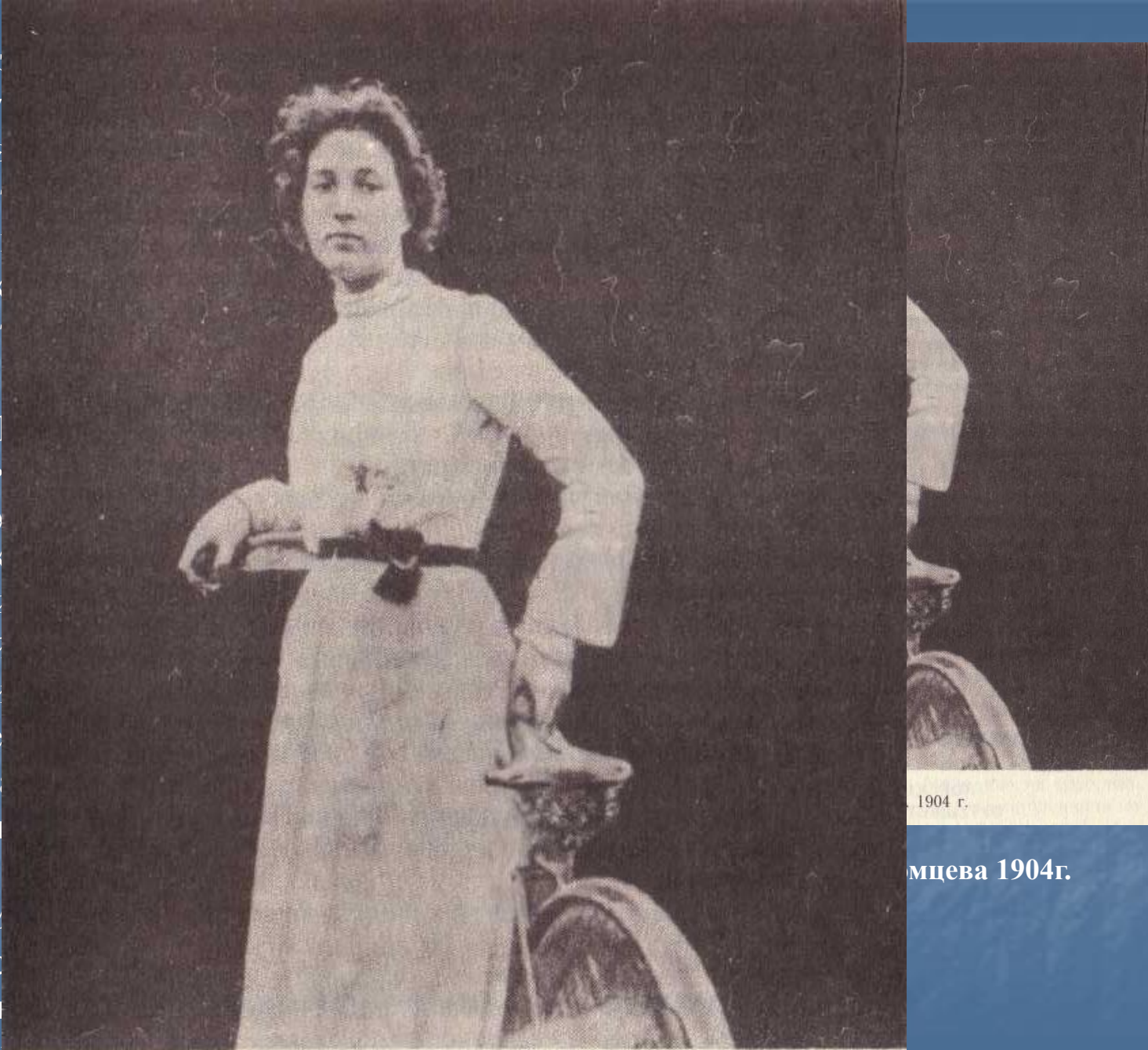
В. Н. Муромцева-Бунина. 1904 г.

В 1906 Бунин познакомился с Николаевной Муромцевой, которая была переводчицей с французского языка и принадлежала к профессорской семье, в которой, как вспоминал Бунин, которая жила в усадьбе в Никитской. Спокойная, прекрасно воспитанная, неплохо владела французским языком и переводами... Вера Николаевна хотела связывать свою жизнь с французской культурой, потому что наслушалась рассказов о жизни людей искусства, что жизни мало и скучно, и, к тому же, менее, именно ей была присуща «тенью» знаменитости. Муромцева была лауреатом Нобелевской премии за переводы. Муромцева и Бунин в 1906 году, официально вступив в брак, они смогли переехать в Париж, Франция. Муромцева была известна литературными переводами и замечательные лекции читала на своём муже ("Жизнь в память").