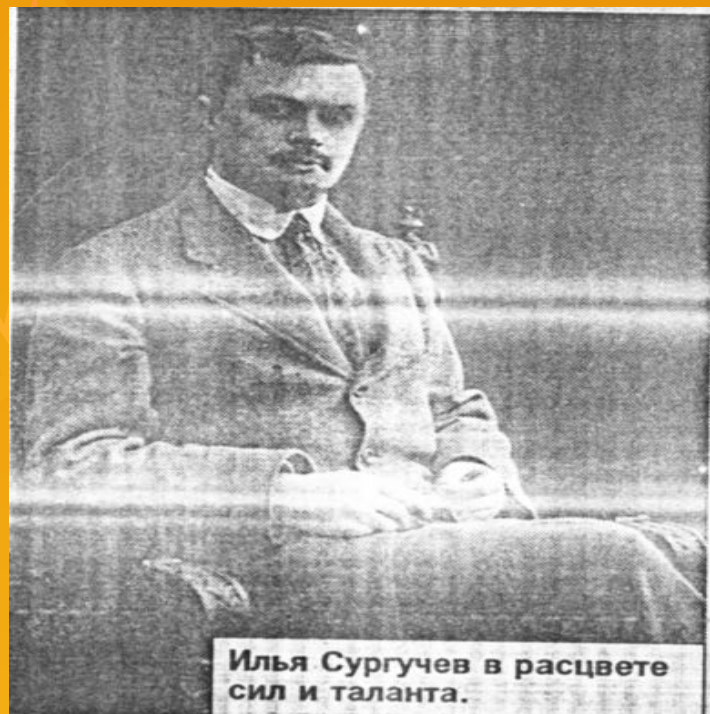
Илья Сургучев в расцвете сил и таланта.

Однако Илья Дмитриевич был вынужден уехать из России. Дело в том, что Сургучев, видя произвол и беззаконие, царившие в период установления советской власти в