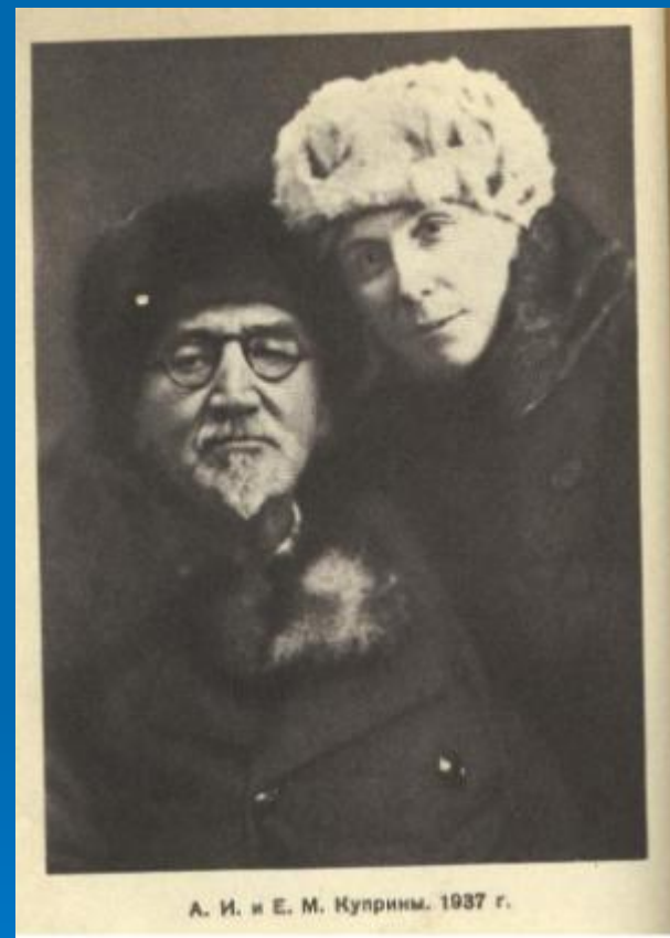
А.И. Куприн и Е.М. Куприна 1937 г.