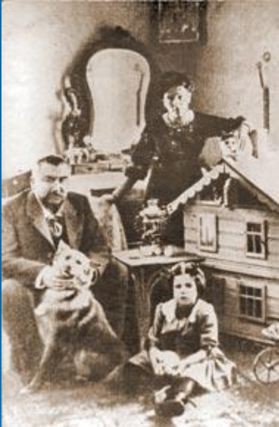
А.И. Куприн, его жена и дочь Ксения в детской комнате зеленого домика