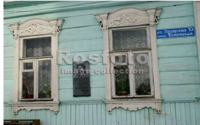
Музей имени А. И. Куприна