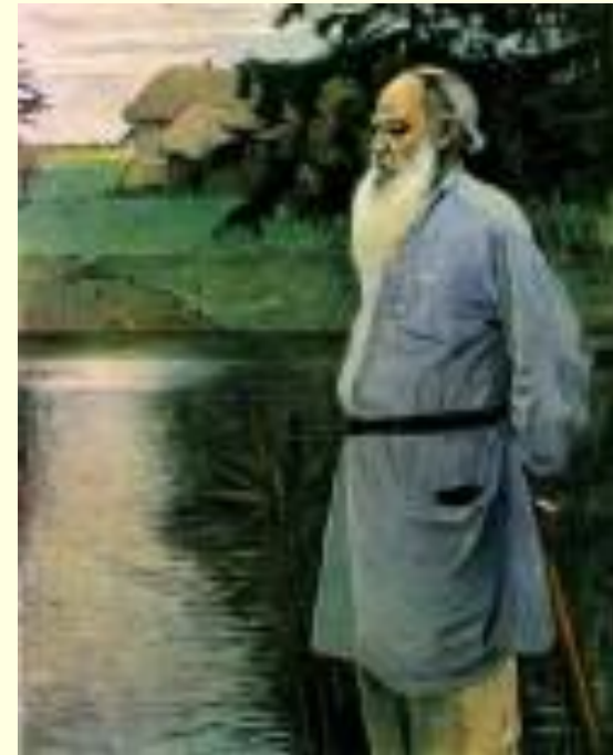
М. Нестеров. Портрет Л.Н. Толстого, 1907