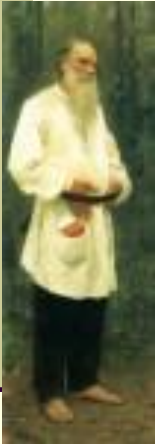
И.Е.Репин. Лев Толстой босой, 1901