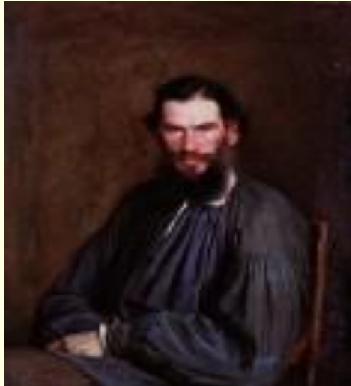
И.Н.Крамской. Портрет Льва Толстого, 1873