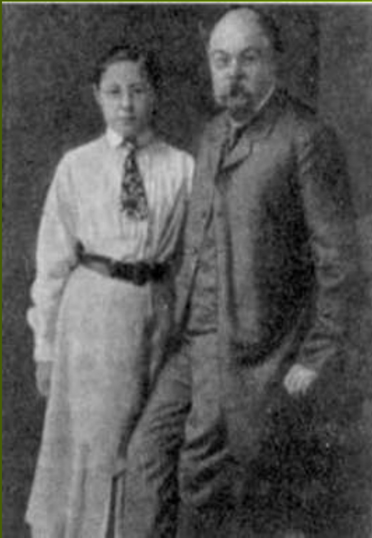
Марина Цветаева с отцом

искусствовед, профессор Московского университета, основатель Московского музея изобразительных искусств имени А.С. Пушкина.