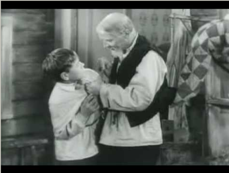
Кадры из к/ф «Детство Горького»