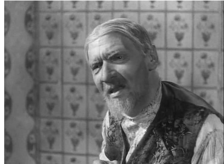
Кадры из к/ф «Детство Горького»