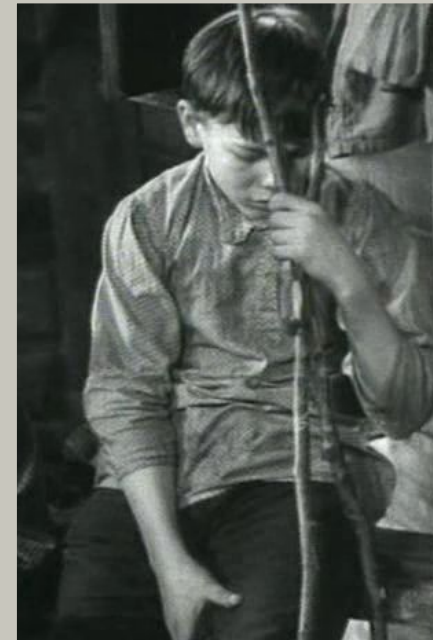
Кадры из к/ф «Детство Горького»