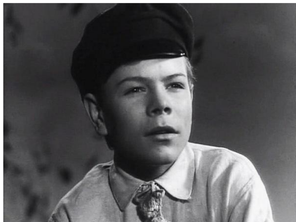
Кадры из к/ф «Детство Горького»