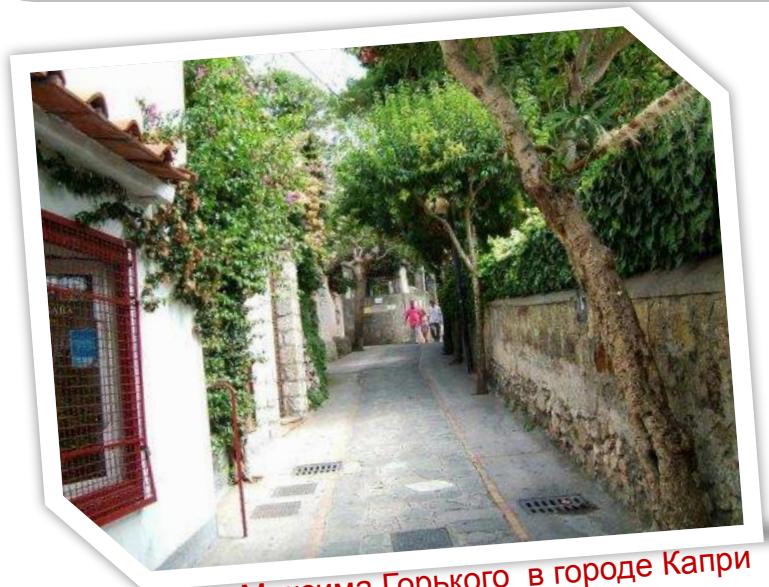
Улица им. Максима Горького в городе Капри

В 1915 году основал журнал "Летопись", руководил литературным отделом журнала.