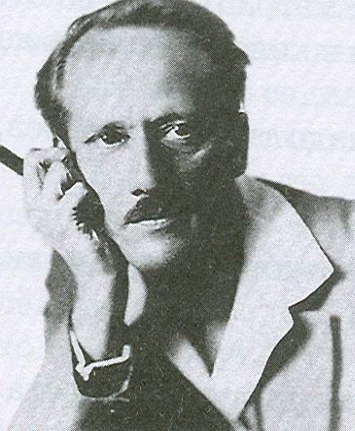
МИХАИЛ ОСОРГИН (1878-1942)