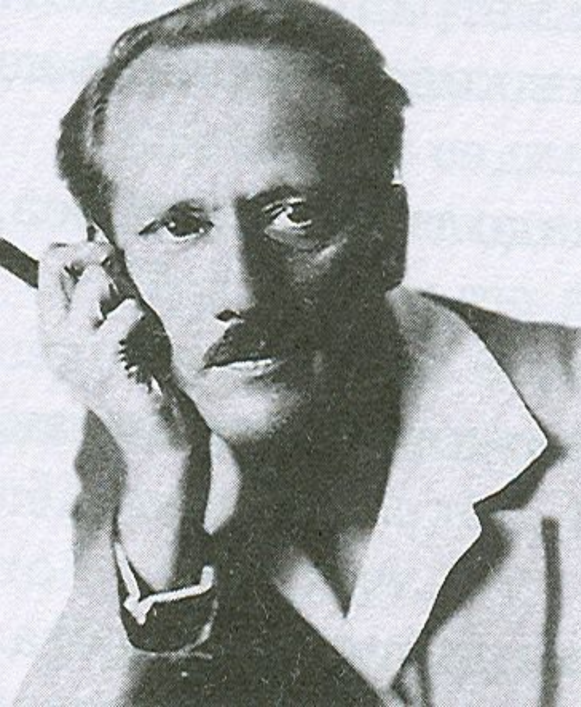
МИХАИЛ ОСОРГИН (1878-1942)