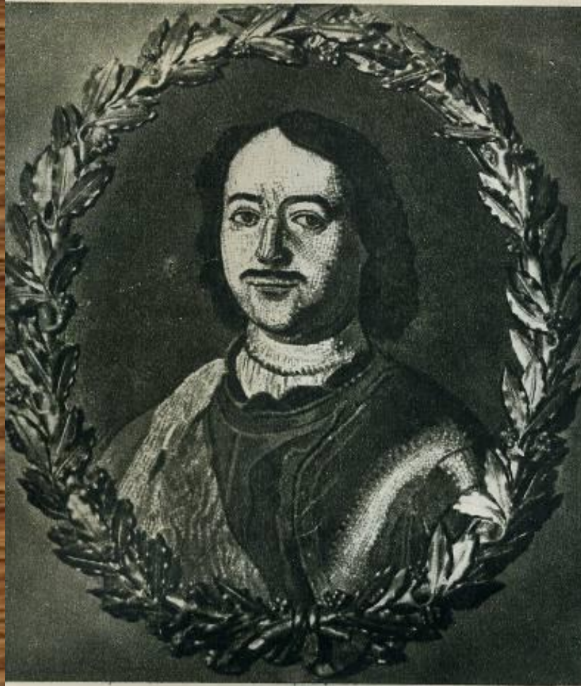
Петр I. Мозаика работы М. Ломоносова.

Возродил древнее искусство мозаики (со своими учениками создал более 40 мозаичных картин).