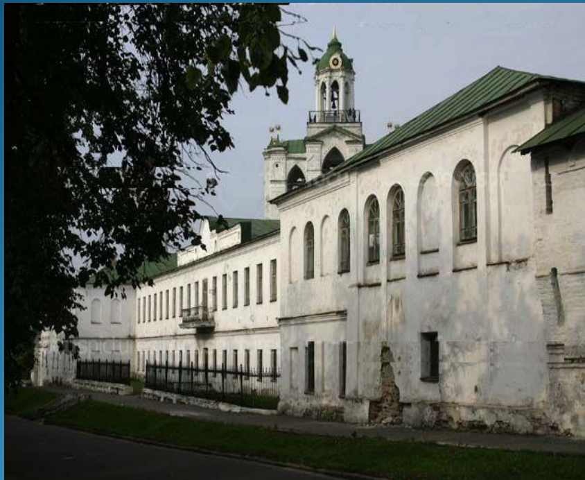
Гимназия, в которой учился Некрасов