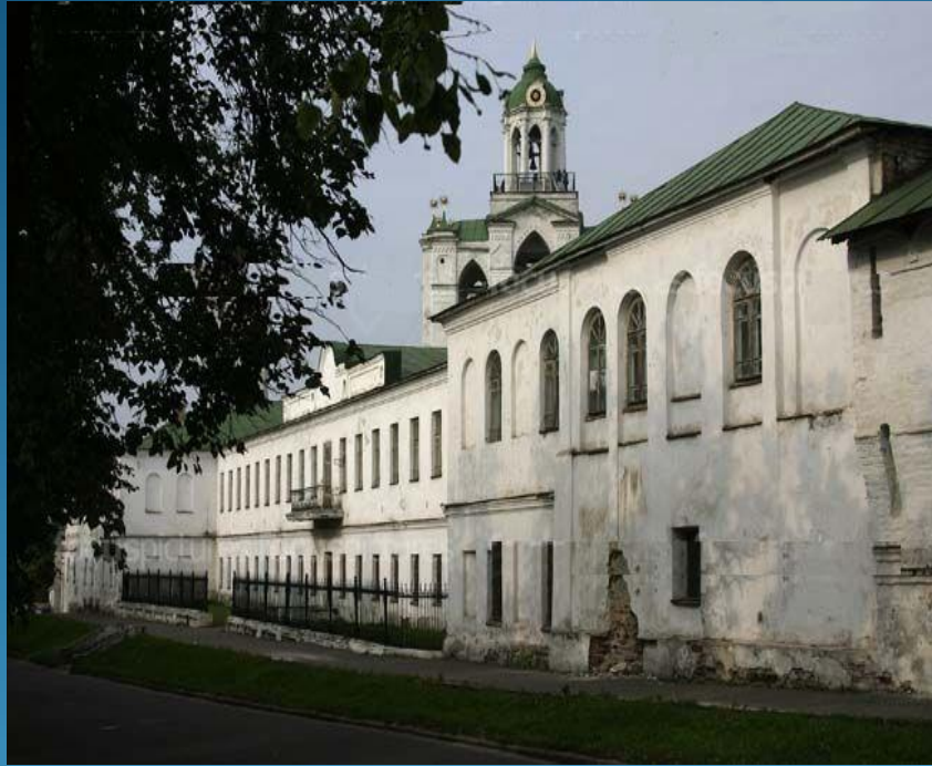
Гимназия, в которой учился Некрасов