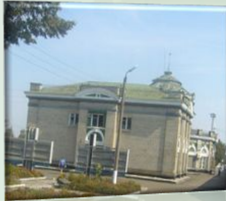
п.Ирпень, Украина, родина Н. Носова