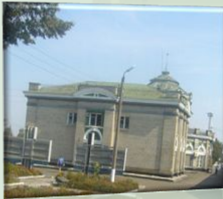
п.Ирпень, Украина, родина Н. Носова

А для того, чтобы эти сухие слова наполнить красками и звуками, стоит открыть его повесть «Тайна на дне колодца». И увидеть маленький посёлок Ирпень неподалёку от Киева, где жила тогда небольшая семья то ли железнодорожника, то ли актёра (это смотря по обстоятельствам) Николая Носова, и где его средний сын, тоже Николай, сделал в буквальном смысле свои первые шаги. Вскоре семья переехала в Киев — пришло время определять мальчиков в гимназию.