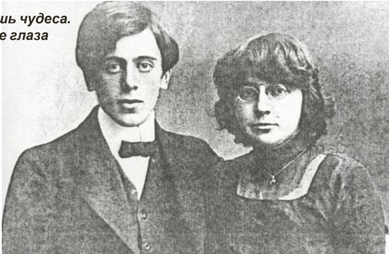
Сергей Эфрон и Марина Цветаева, 1911

Есть такие голоса, Что смолкаешь, им не вторя, Что предвидишь чудеса. Есть огромные глаза Цвета моря.