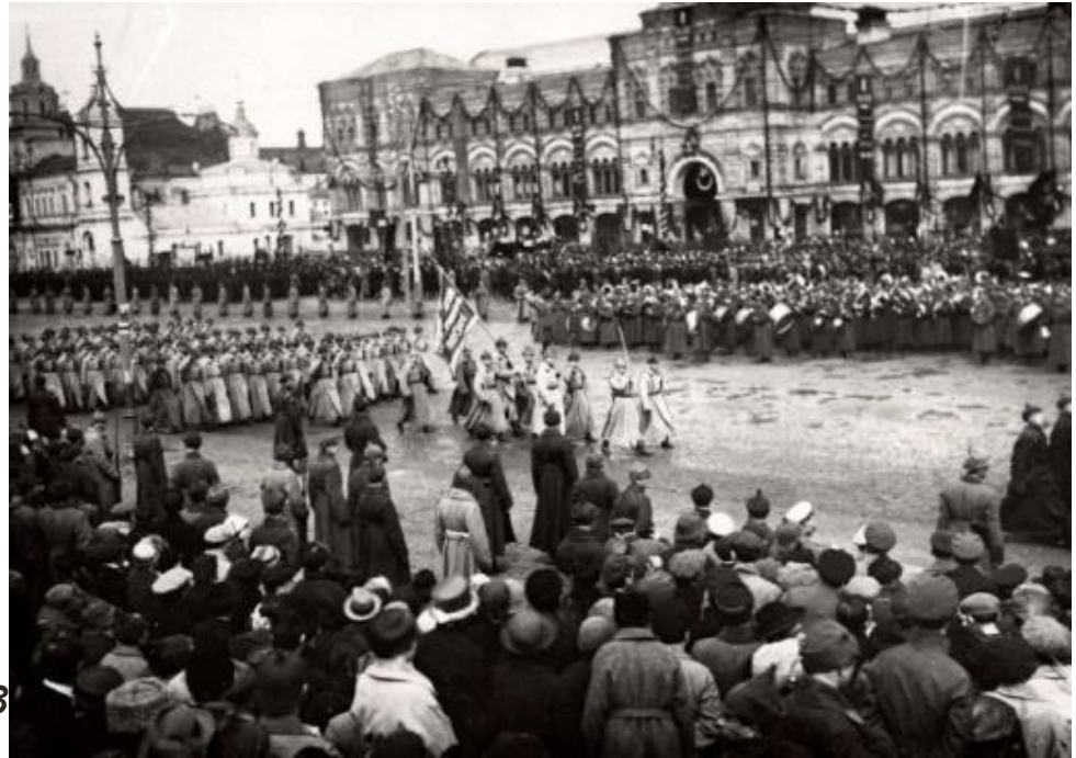
Москва, 20-е гг.

Война, война! - Каждыйя у киотов И стрёкот шпор.