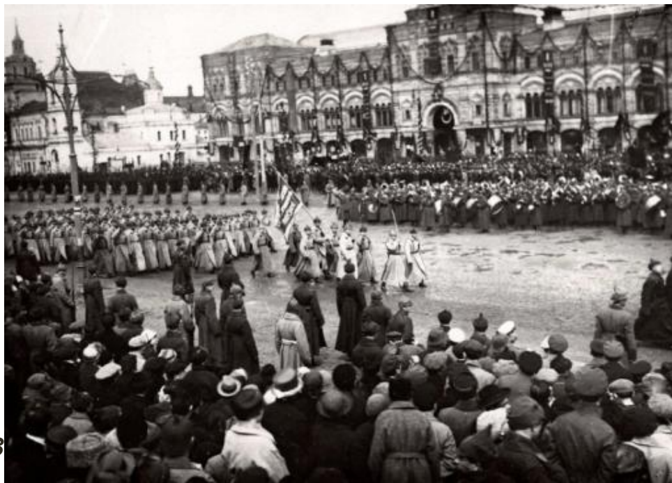
Москва, 20-е гг.

Война, война! - Каждыйя у киотов И стрёкот шпор.