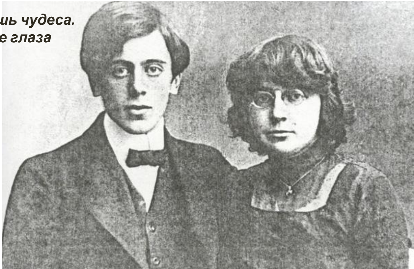
Сергей Эфрон и Марина Цветаева, 1911

Есть такие голоса, Что смолкаешь, им не вторя, Что предвидишь чудеса. Есть огромные глаза Цвета моря.