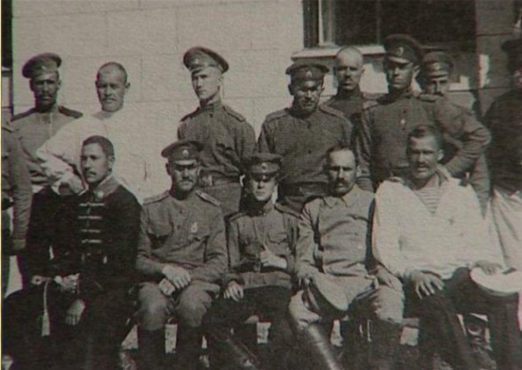
Сергей Есенин на военной службе. Сидит в первом ряду, в середине