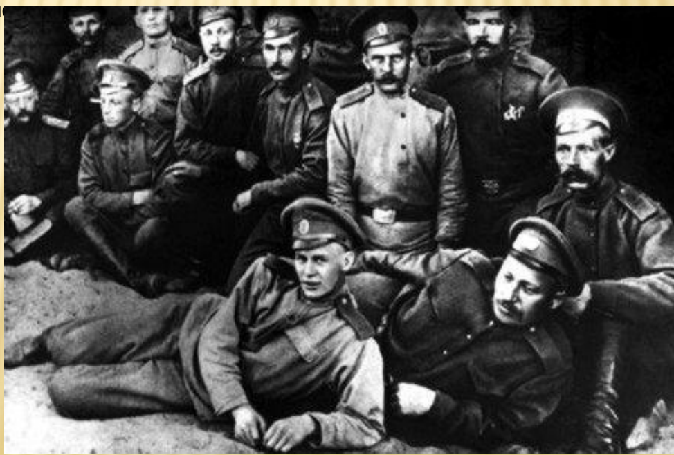
Сергей Есенин среди санитаров царско-сельского полка санитарного поезда № 122