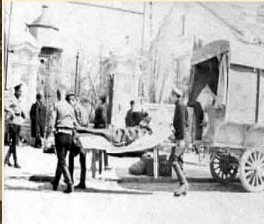
Сергей Есенин санитар. Стоит спиной.