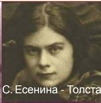
С. Есенина - Толстая